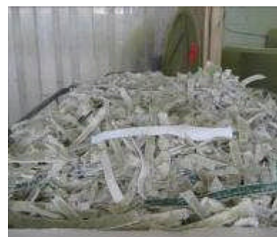
5 pav. Susmulkintos stiklaplasčio atliekos

Lietuvoje susidarančių atliekų kiekis nuolat didėja, o perdirbama jų tik labai maža dalis, todėl atliekų tvarkymas šiai dienai yra labai opi problema. Atliekų perdirbimas tausoja gamtą, gamtinius išteklius, organizacijos gauna pelną ir išsaugo savo aplinką. „Traidenis“ pradėjo ieškoti būdų kaip būtų galima perdirbti susidariusias stiklaplasčio atliekas, kurių kiekis kasmet taip pat didėja augant gamybai. Ateityje ketinama plėsti bendradarbiavimą šioje srityje su užsienio įmonėmis, įsigyti papildomus atliekų smulkintuvus bei pasidalinti šia patirtimi Lietuvoje.