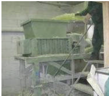
4 pav. Stiklaplasčio atliekų smulkintuvas