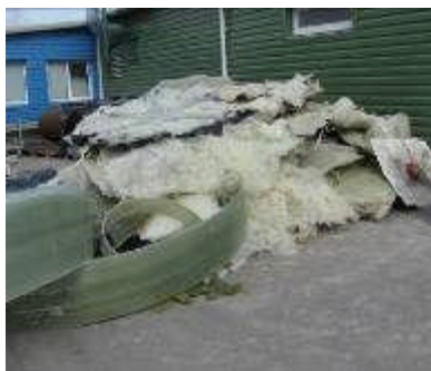
3 pav. Nesmulkintos stiklaplasčio atliekos

Atliekų smulkintuvo įdiegimo tikslai: smulkinti atliekas, kurias paskui galima panaudoti antriniam panaudojimui, neteršti gamtos, taupyti žaliavas, resursus.