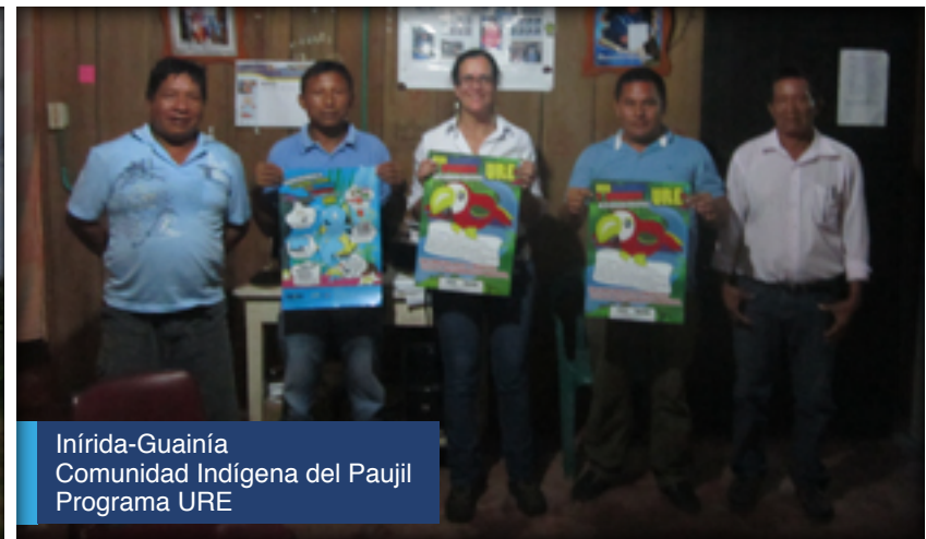
Inírida-Guainía Comunidad Indígena del Paujil Programa URE