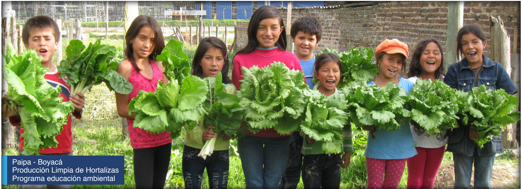
Paipa - Boyacá Producción Limpia de Hortalizas Programa educación ambiental