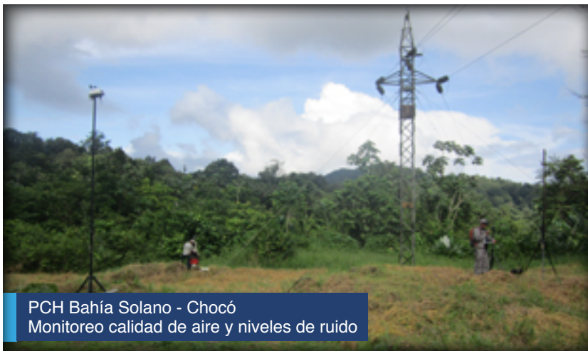
PCH Bahía Solano - Chocó Monitoreo calidad de aire y niveles de ruido