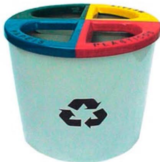
Projeto de Redução de Impactos Ambientais

têm parcerias com o FOMEN em um acordo de cooperação grama “Bom Negócio Paraná” aos empreendedores informais nas empresas, que tenham gestão através do programa de outros cursos de Capacitação possam obter o crédito sub-EMPREENDEDOR, bem como a recepção e encaminhamento, bem como trabalhos informações cadastrais, de coleta e processamento de dados.