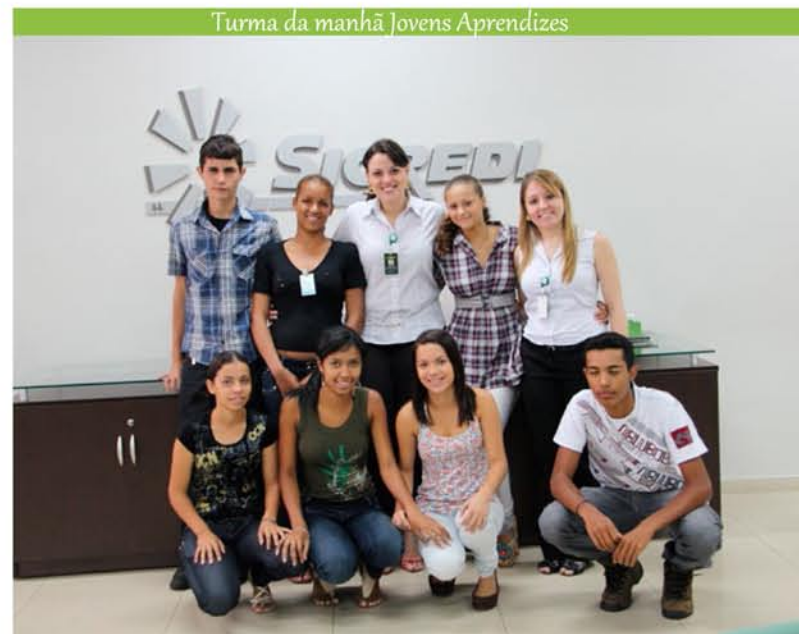
Turma da manhã Jovens Aprendizes

A cooperativa Sicredi em seus valores busca a valorização e desenvolvimento das pessoas, incluindo todos os atores sociais os quais se relaciona em especial seus colaboradores. O Sicredi repudia toda e qualquer forma