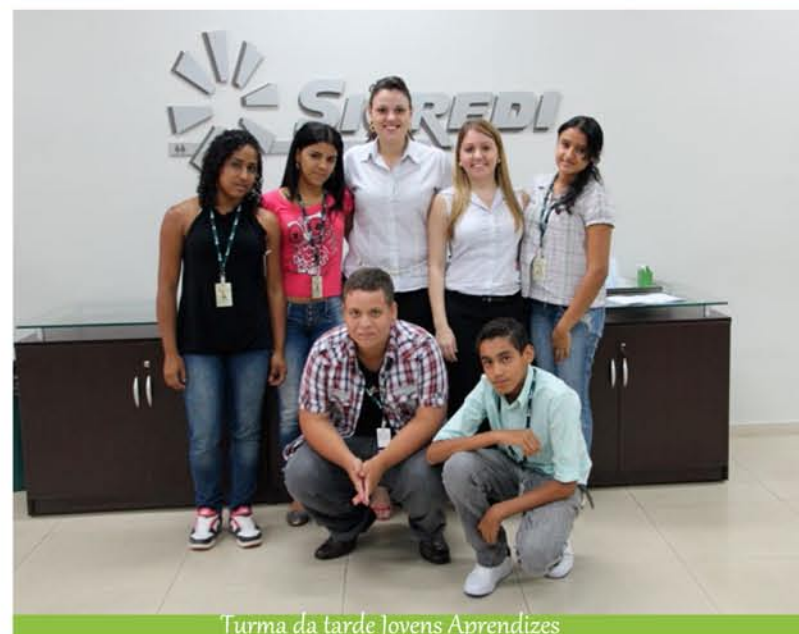
Turma da tarde Jovens Aprendizes

de preconceito, discriminação e assédio, e assume o compromisso de apurar e ações de humilhação e intimidação. O Sicredi promove um ambiente inclusivo que pessoas e em especial a mulher. A cooperativa possui em seu quadro de colaboradores entre 15 e 61 anos, assim como também valoriza a inclusão social ao contratar