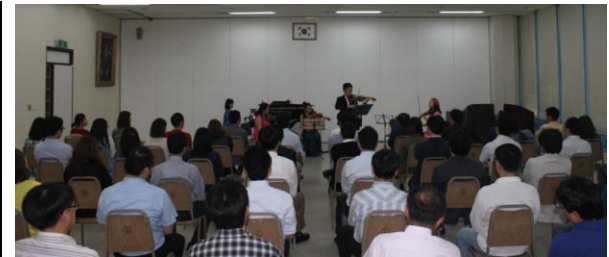
<임직원을 위한 음악회 2012. 9>