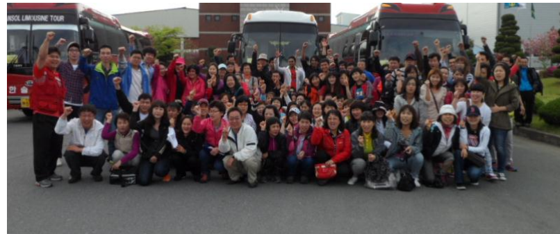
<2012년 근로자의 날 행사>