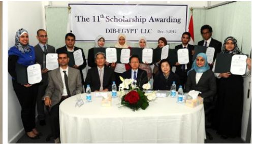
<해외법인(DIB-Egypt) 장학금 수여>