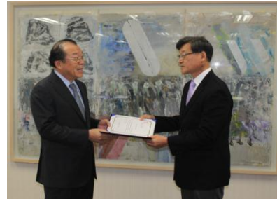
<정헌섬유도서관 운영비 전달>