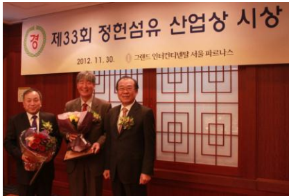
<정헌섬유 산업상 시상>