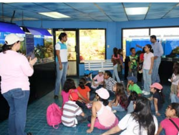
Giras ecológicas para los niños del "Mini Morgan"