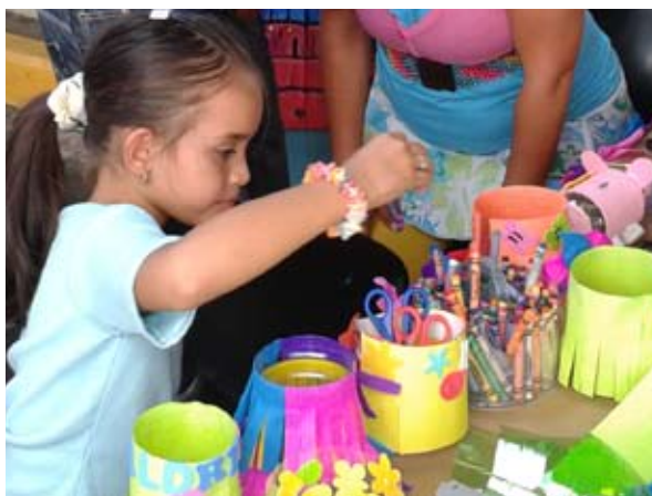
Ferias de reciclaje