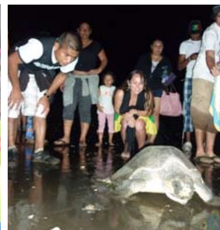
Gira ecológica en Pedasí