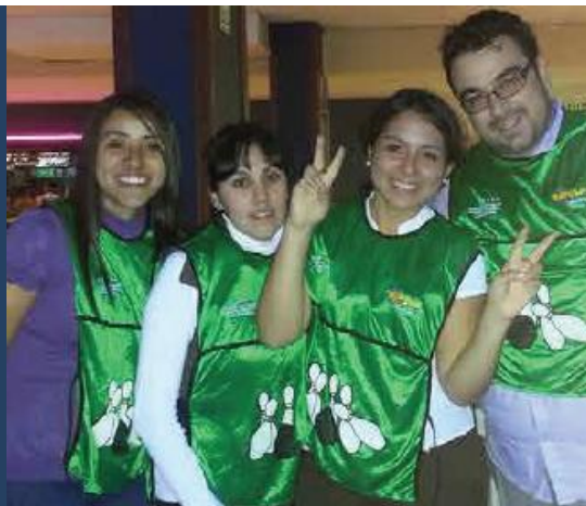
“Torneo de Bolos”