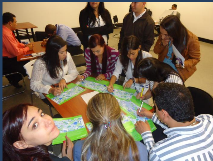
“Cazadores de riesgos”