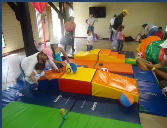
“Celebración día del Niño”