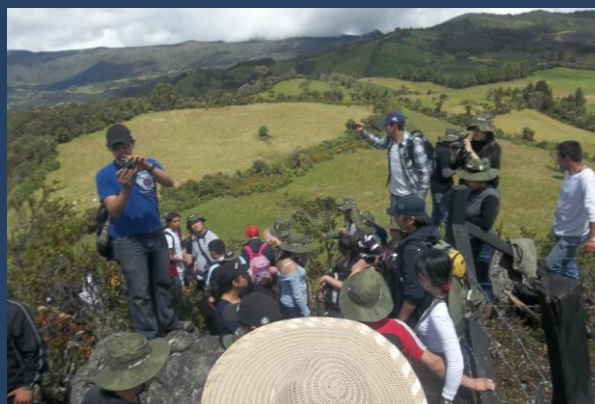
“siembra de árboles Bogotá”