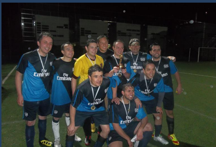
Torneo de Fútbol masculino Bogotá 2012