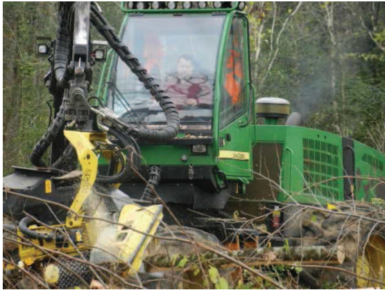
Abatteuse en Europe (ci-dessus) et exemple d'application des règles de sécurité sur un chantier forestier

Comme mentionné au chapitre précédent relatif aux droits de l'Homme, Oréade-Brèche a effectué 6 audits en 2012 dans le cadre de la certification des activités forestières qui prennent en compte la dimension « droit du travail ».