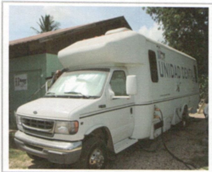
Illustration 11: Vista frontal Unidad Odontológica Móvil