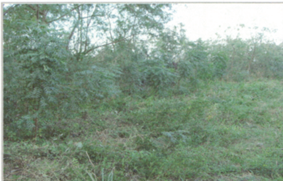
Illustration 21: Cinturón verde reforestado en la zona minera El Peñón