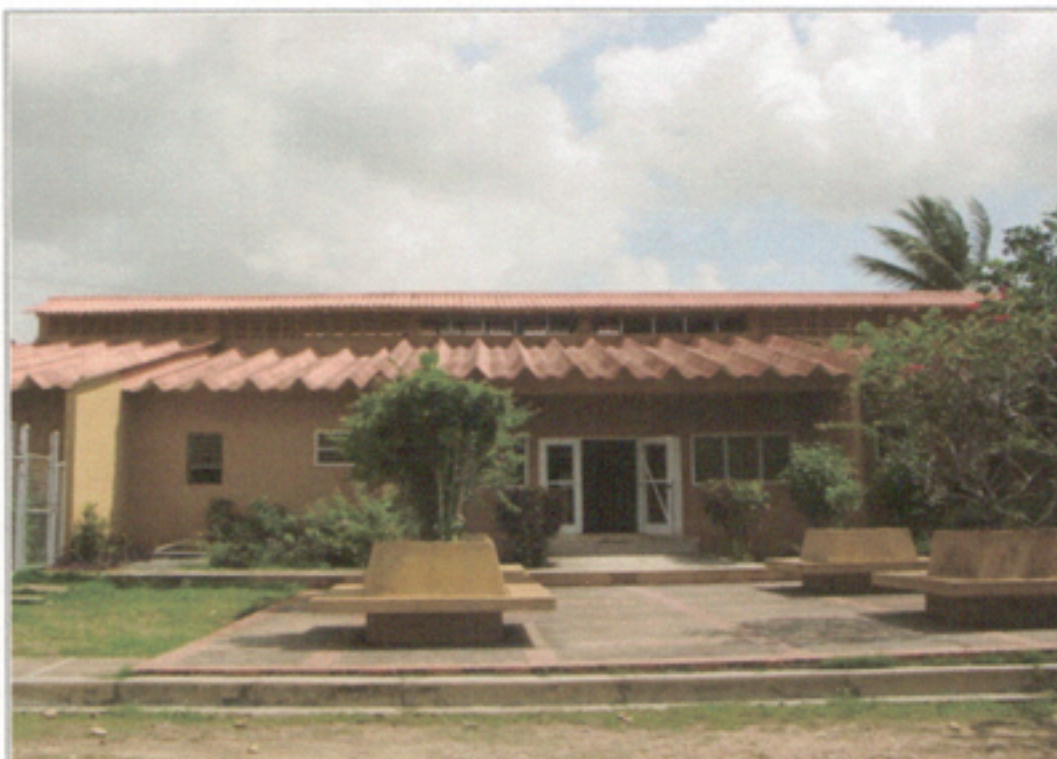
Illustration 3: Sub-centro Asistencial Médico Lechugas