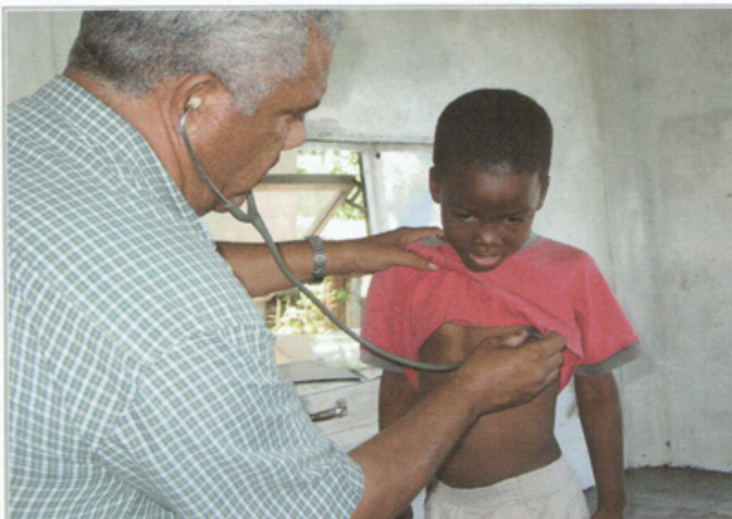
Illustration 10: Dentro de la Unidad Médica Móvil #2