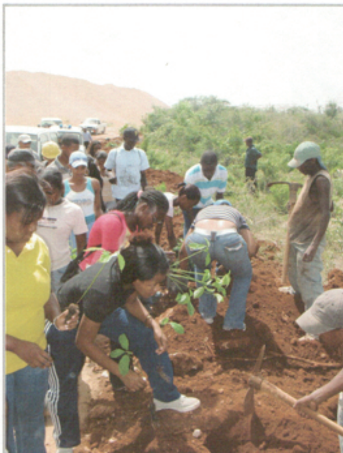
Illustration 20: Jornada de reforestación en la zona minera El Peñón