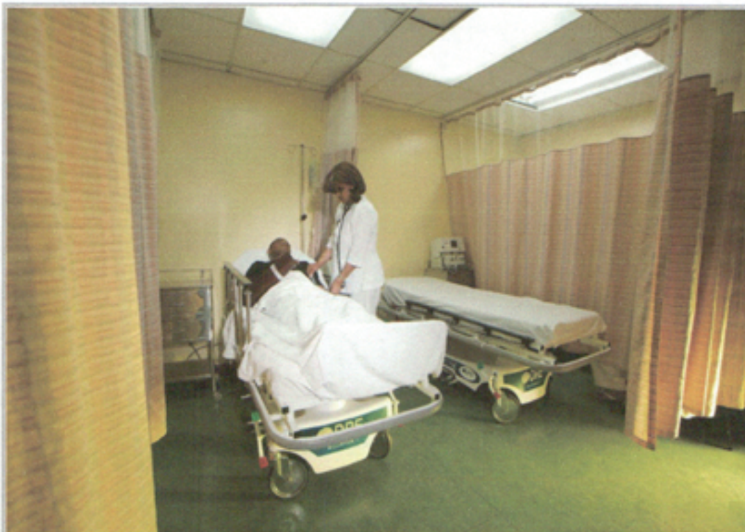
Illustration 2: Sala de Emergencias Centro Médico Central Romana