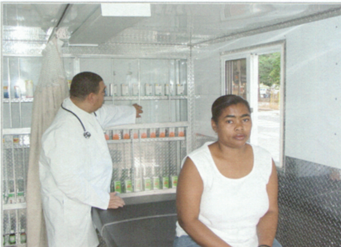
Illustration 8: Instalaciones dentro Unidad Médica Móvil #3