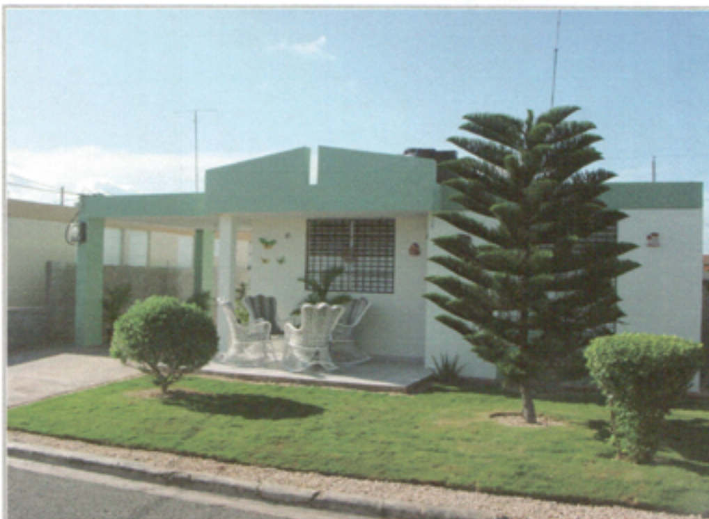
Illustration 19: Vivienda modelo en el sector La Caleta