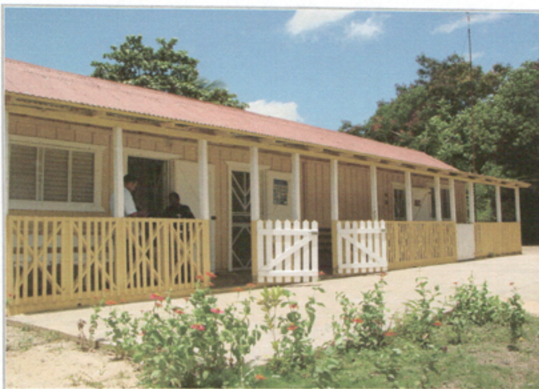
Illustration 5: Sub-centro Asistencial Médico Baiguá