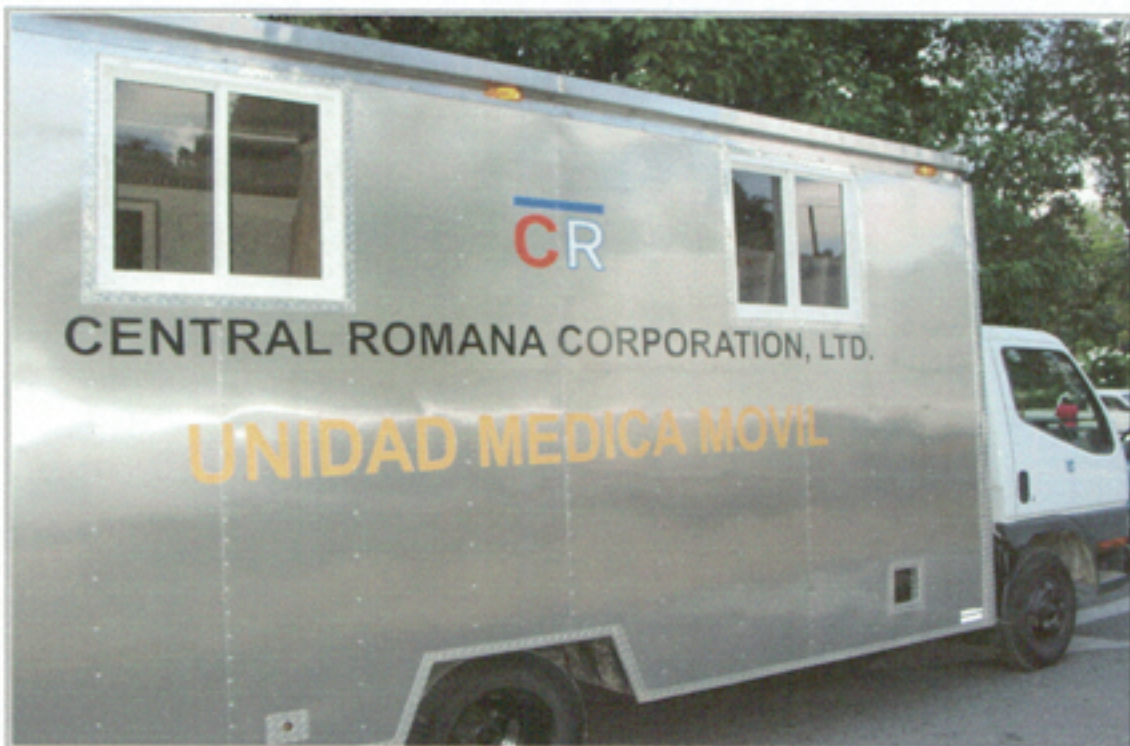
Illustration 7: Unidad Médica Móvil #3