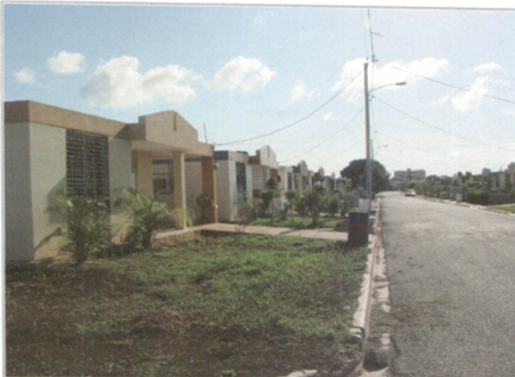
Illustration 18: Proyecto de viviendas del Central Romana en el sector La Caleta