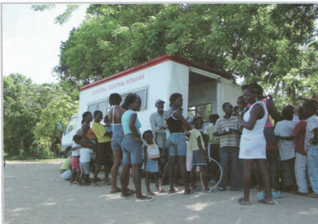
Illustration 9: Unidad Médica Móvil #2