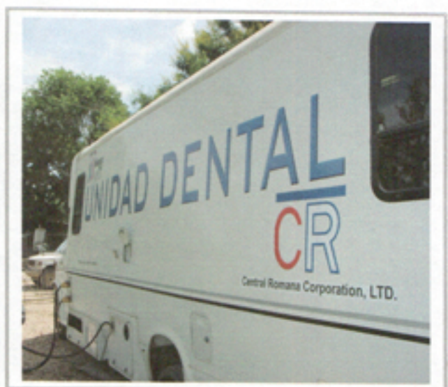
Illustration 12: Vista lateral Unidad Odontológica Móvil