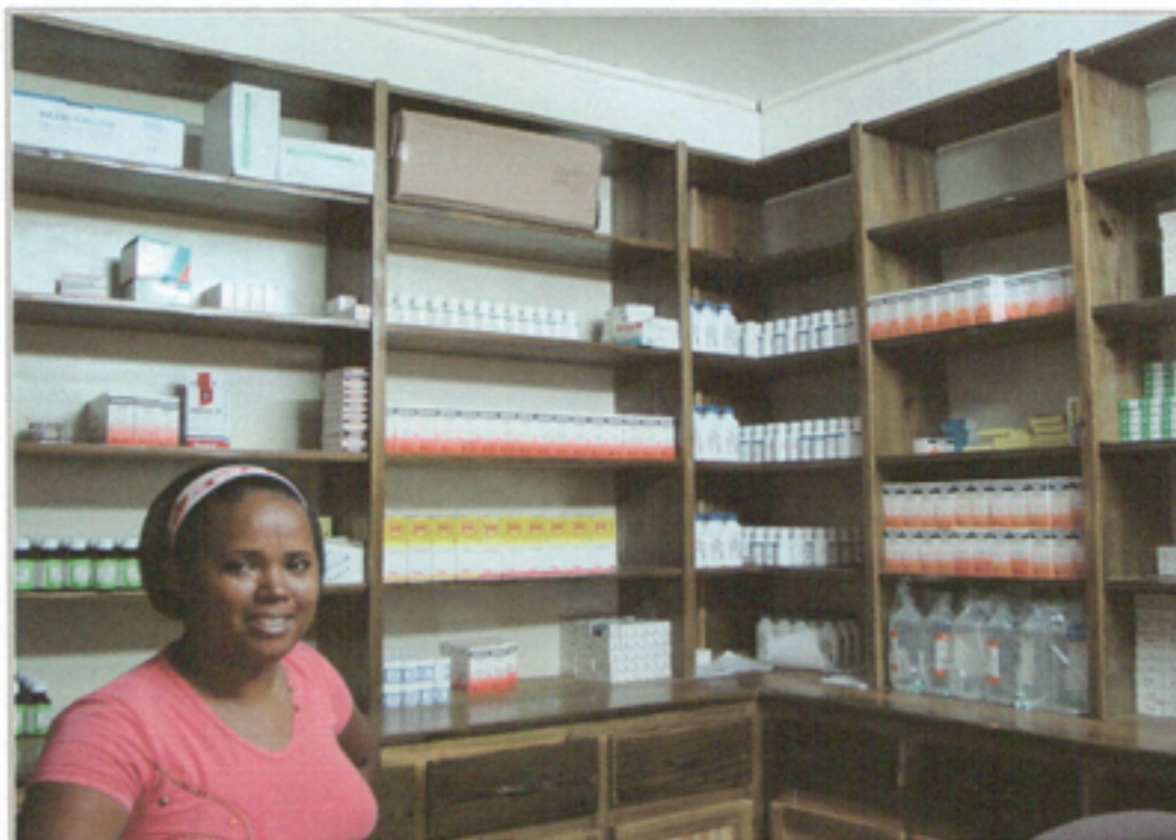
Illustration 6: Dispensario médico Sub-centro Baiguá