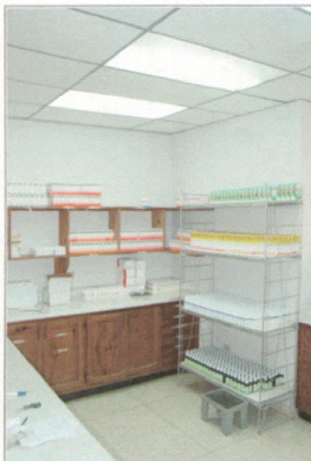
Illustration 4: Dispensario médico Sub-centro Lechugas