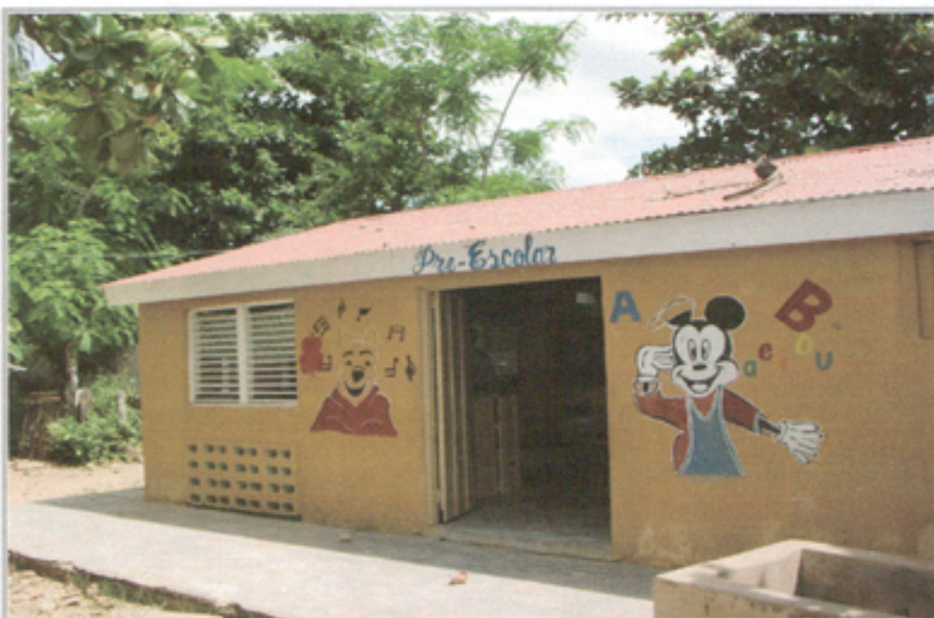
Illustration 16: Preescolar Escuela Batey Magdalena en zona cañera