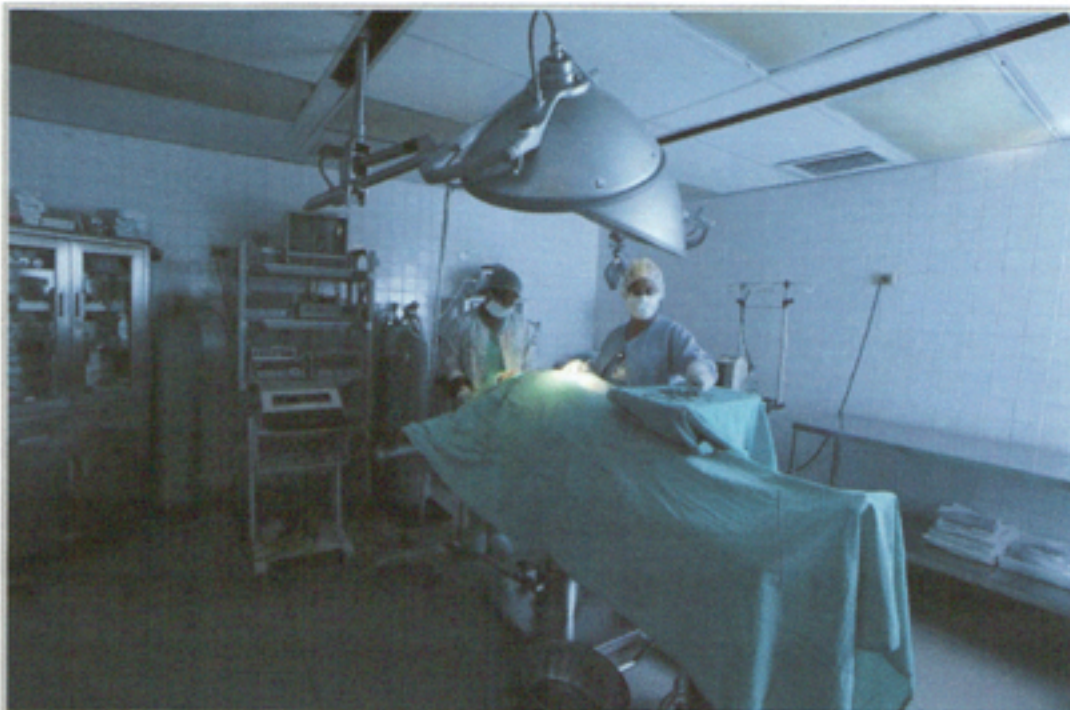
Illustration 1: Sala de Cirugía Centro Médico Central Romana