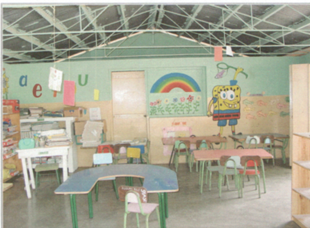
Illustration 17: Salón de clases Preescolar Batey Magdalena