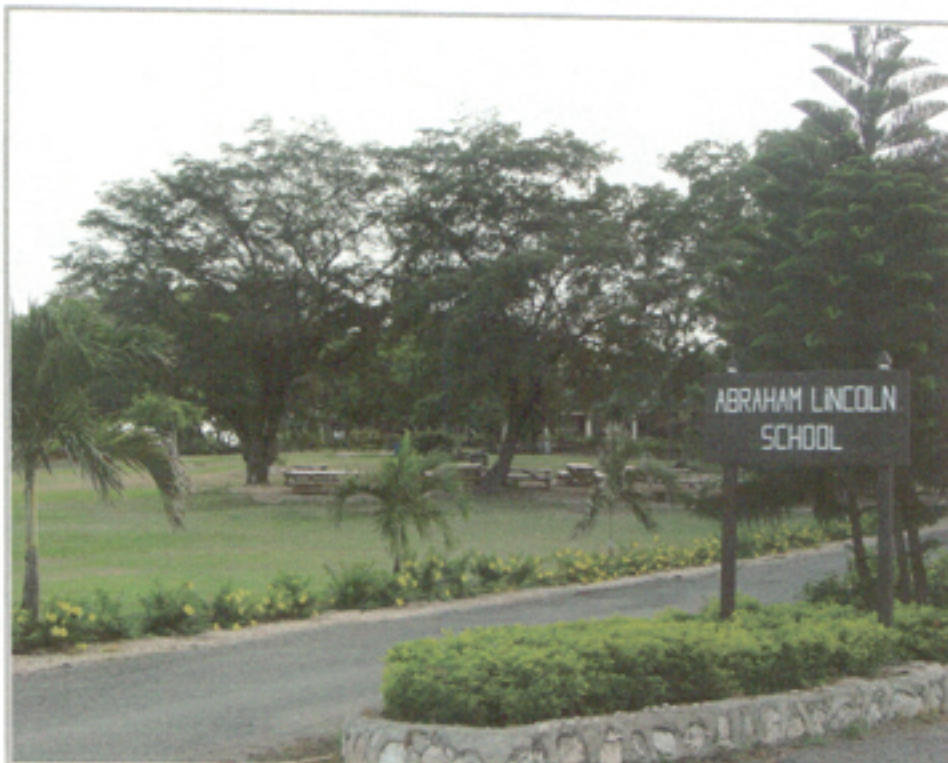
Illustration 14: Escuela Abraham Lincoln School