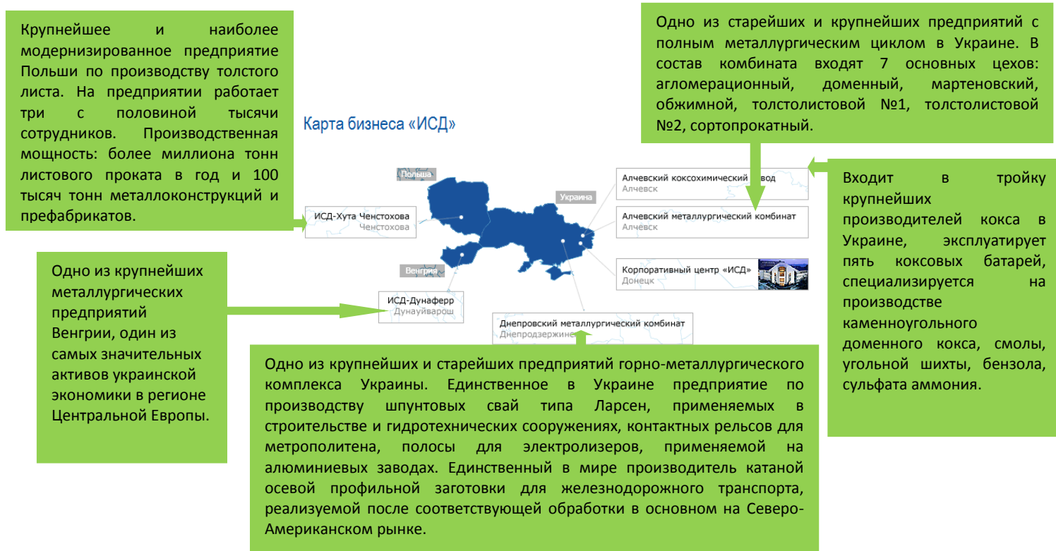
Рис. 1. Карта предприятий Корпорации «ИСД»

Корпорация «ИСД» - лидер в области технического перевооружения металлургических комбинатов