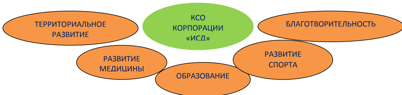
Рис. 3. Приоритетные направления КСО Корпорации «ИСД»

Наши предприятия внедряют десять принципов корпоративной социальной ответственности в своей операционной деятельности.