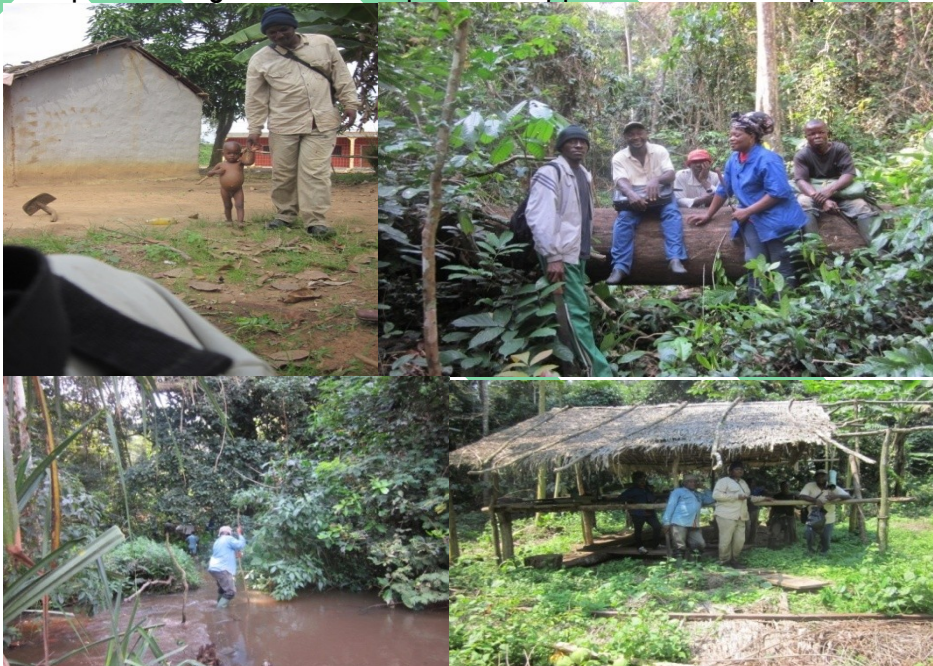
Les volontaires du TIDA , en plein forêt dans la Région de l'Est

La recherche dans la région où existe la prévalence de la corruption, de la faim et donne une image objective de travail et conditions de vie des populations vulnérables. Il permet de cibler son soutien le plus efficace et informe la conception de ses programmes. TIDA part des enseignements tirés et des exemples de bonnes pratiques afin que les dirigeants locaux puissent apprendre de son expérience.