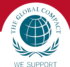
Tabla de contenido:

Esta tabla de contenido presenta la conexión de indicadores del Informe de Progreso de la Red Española de Naciones Unidas con los indicadores GRI. Para alcanzar el nivel C de reporting de la iniciativa GRI, se requiere que la entidad cumplimente los puntos mencionados a continuación: