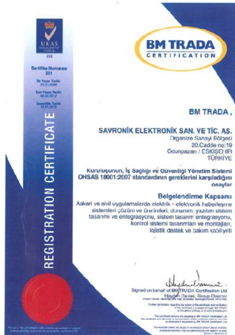
TS EN ISO 18001:2007 İş Sağlığı ve Güvenliği Yönetim Sistem