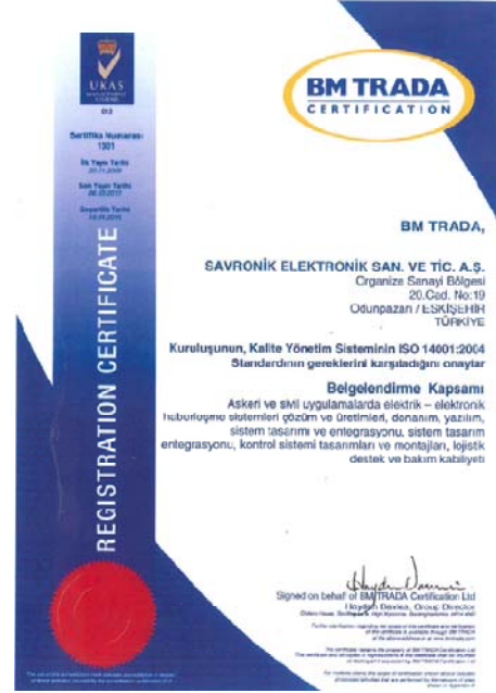
TS EN ISO 14001:2004 Çevre Yönetim Sistemi