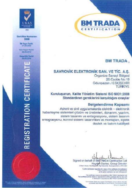
TS EN ISO-9001:2008 Kalite Yönetim Sistemi