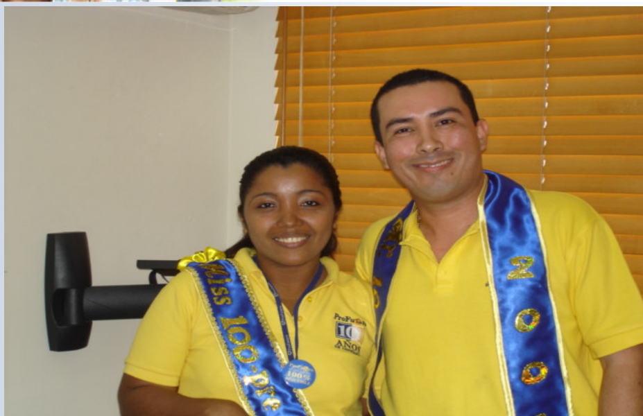
Ganadores del Concurso 100 – pre Fit 2006