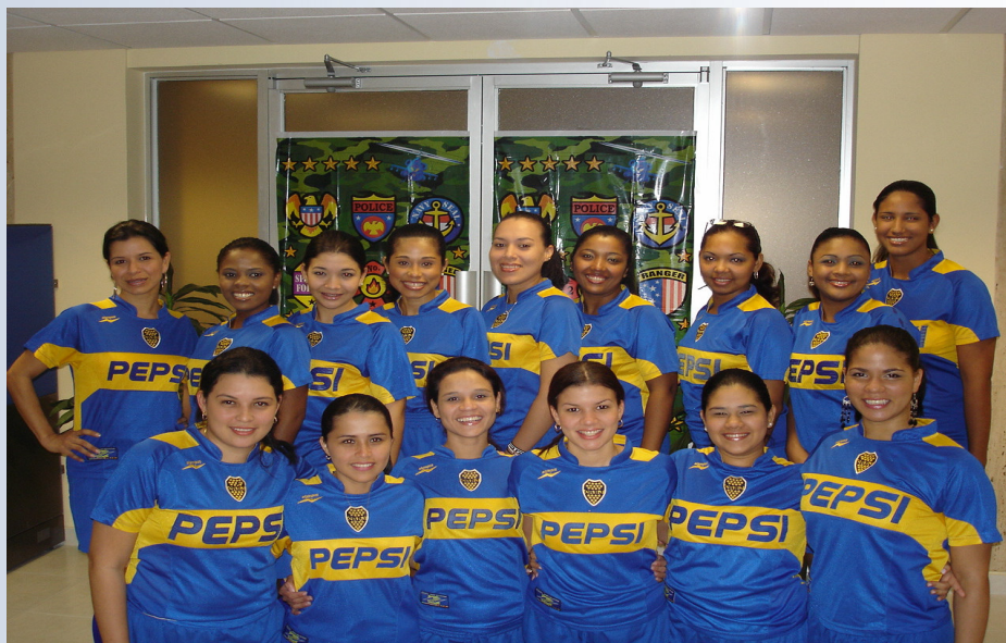
Equipo femenino de fútbol el cual participó en la liga empresarial que se desarrolló en la cancha de Multi Sports.