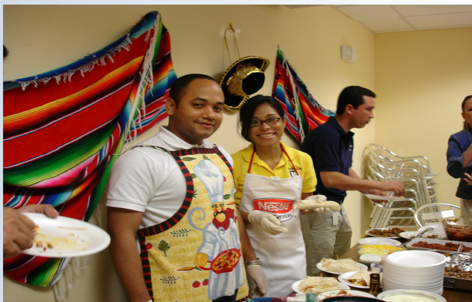
Venta de comida realizada para recaudar fondos en beneficio de la obra social realizada en la comunidad de Altos de Pedregal.