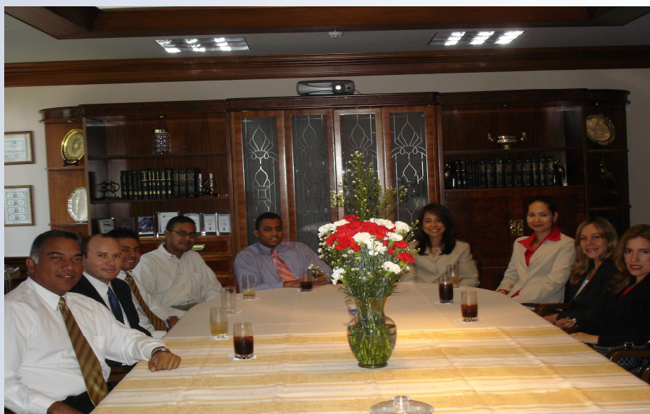
Entrega de Bono de Lealtad 2006. Dicho bono es otorgado a los colaboradores al cumplir 5, 7 ó 10 años de laborar en la empresa.