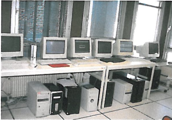
Salle informatique Groupe MB AVANT la virtualisation, le 1er juin 2008:

Avec la mise en place de la virtualisation, notre consommation électrique est passée de 1500 W pour six serveurs avec moniteurs à 700 W pour un serveur et une baie de stockage.