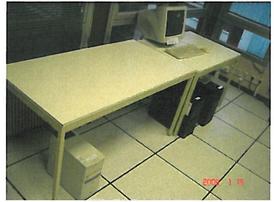
Salle informatique Groupe MB APRES la virtualisation, le 15 janvier 2009 :