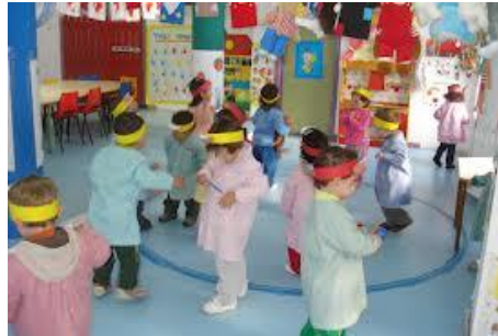
Guarderías: mejoras proyecto