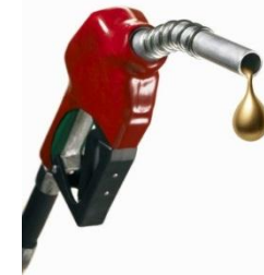
Apoyo semanal Combustible