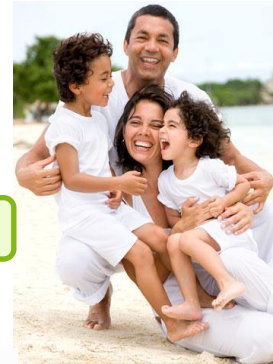
Lograr armonía en las FAMILIAS