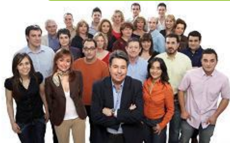
Colaboradores: Unión, Servicio y Atención personalizada