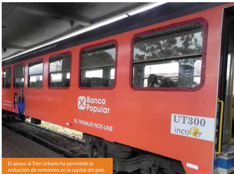
El apoyo al Tren Urbano ha permitido la reducción de emisiones en la capital del país.

En procura de incentivar el uso de medios de transporte colectivo como mecanismo para la reducción de emisiones de dióxido de carbono ( \text{CO}_2 ), se apoyó al Instituto Costarricense de Ferrocarriles (INCOFER) mediante el patrocinio al "Tren Urbano". Este medio de transporte fue utilizado por 2.109.886 personas en el año 2011 y genera descongestionamiento de las principales vías públicas del Gran Área Metropolitana (GAM).