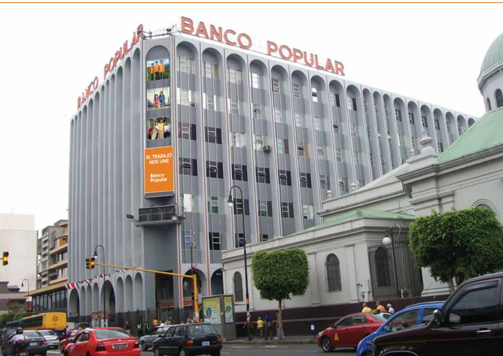
Fachada oficinas centrales Banco Popular.

poblaciones excluidas del sistema financiero tradicional.