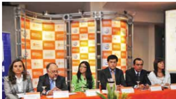
Autoridades del Banco Popular, la UICN, Ministerio de Ambiente y Ministerio de Vivienda durante presentación del I Concurso de Vivienda Sostenible.

Mediante una alianza establecida con la Unión Internacional para la Conservación de la Naturaleza (UICN), el Ministerio de Vivienda y Asentamientos Humanos (MIVAH) y el Ministerio de Ambiente, Energía y Telecomunicaciones (MINAET), el Banco Popular fue eje central en el desarrollo del I Concurso de Vivienda Sostenible. Este certamen de arquitectura convocó a 40 equipos multidisciplinarios. La actividad, además de crear sensibilidad sobre la construcción sostenible, desmitificó la idea de que esta opción constructiva no es accesible a la clase media.