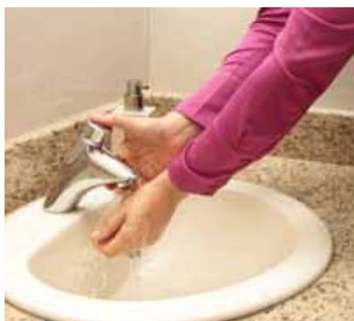
Grifería ecoeficiente en el Banco Popular.