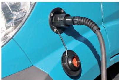
Branchement câble électrique