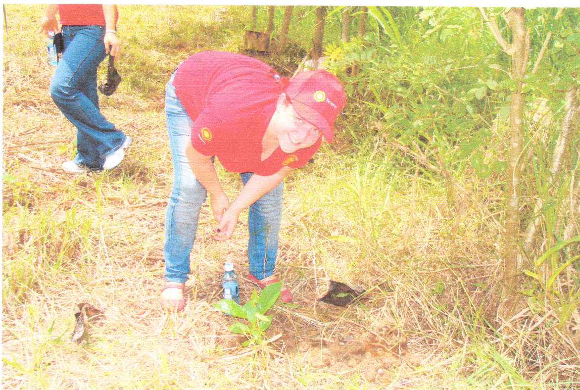
SIEMBRA DE ARBOLES EN EL PARQUE METROPOLITANO 2009.

Esta estrategia incluye acciones en las áreas de mantenimiento de equipos, y oficinas. Terpel Panamá desarrolla una cultura ambiental corporativa fomentando iniciativas que favorecen la responsabilidad de sus colaboradores en los temas de prevención y conservación del medio ambiente, y garantiza una administración que