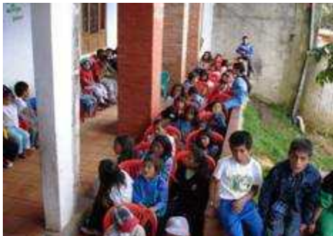
Niños colombianos de la Fundación Ángel de la Luz.

Por su lado, Colombia , que ingresó a Grupo Banistmo recién en el 2005, también inició este año su proceso de RSE. Estos primeros pasos se han dado con la