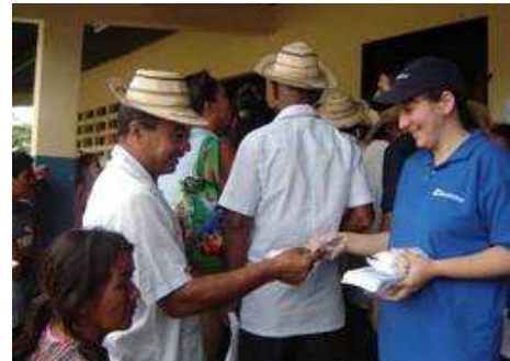
Las giras médicas llegan a comunidades aisladas.

Como empresa socialmente responsable, hemos adquirido el compromiso de ampliar nuestro cometido a más comunidades, con el propósito de mejorar la calidad de vida de compatriotas que necesitan de nuestra mejor disposición, de nuestro trabajo y de nuestra voluntad.