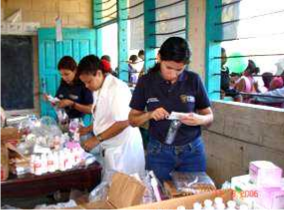
Colaboradores de BGA, en Honduras, en gira médica.

En el 2005 se instauraron en ciertos países proyectos específicos aunados a resaltar una responsabilidad social global del Grupo. Por estar algunos aún en etapa de integración, consideramos que son los primeros pasos hacia una ciudadanía corporativa responsable, encaminada a llenar los parámetros exigidos por el Grupo.