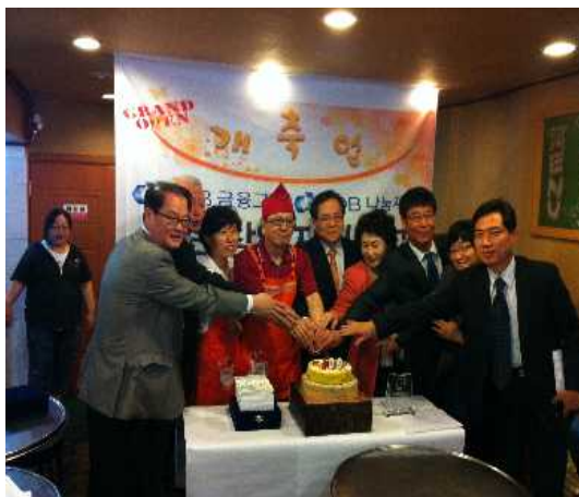
마이크로 크레딧 관련 개업 사진

2011년 KDB산업은행은 저소득층 서민과 개인신용불량자의 자립을 위한 마이크로크레딧 사업지원 용도 등으로 미소금융중앙재단 및 신용회복위원회에 128억원을 기부하였습니다. 또한 KDB나눔재단에 104억원을 출연하였고, 이 재원을 바탕으로 '희망의 디딤돌-기능사 양성사업'과 'KDB창업지원기금' 등의 프로그램을 실시하여 저소득 금융소외계층의 자립을 돕기 위한 지원사업을 활발하게 실시하고 있습니다.