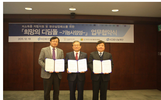
희망의 디딤돌 업무 협약식