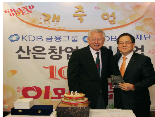
KDB창업지원기금 100호점 개업기념