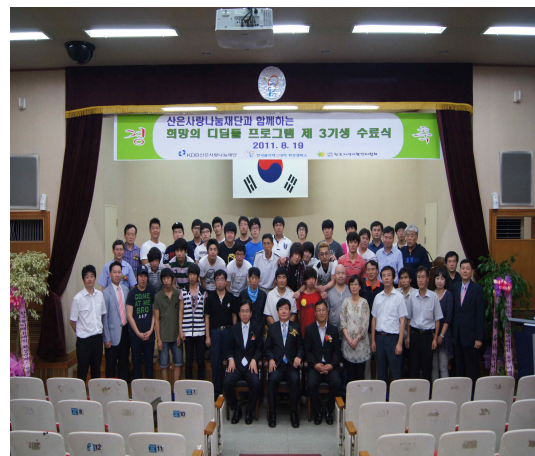
희망의 디딤돌 수료식