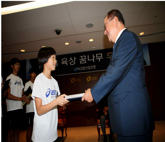
육상 꿈나무 기부

KDB산업은행은 임직원들의 급여에서 일정부분을 모은 기부금과 은행의 지원금 등을 재원으로 형편이 어려운 학생들을 돕는 산은 장학금제도를 실시하고 있습니다. 이를 통하여 현재 300여명의 초, 중, 고 학생들에게 고등학교 졸업 때까지 매월 학자금 및 생활보조금을 지원하고 있으며, 매년 진행되는 산업 시찰 프로그램을 통하여 리더십 배양 및 진로 모색에 도움을 주고 있습니다. 또한 2001년부터 매년 도서벽지 어린이 서울초청 행사와 청소년 경제교육 자원봉사(JA Korea) 등을 통하여 장래 대한민국을 이끌어 갈 꿈나무들에게 희망과 비전을 심어주려 노력하고 있습니다.