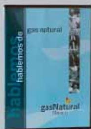
Video didáctico "Hablemos de Gas Natural"