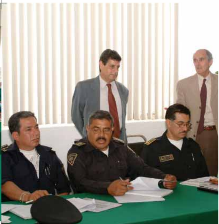
Curso "Fundamentos básicos del gas natural" impartido por el CONIQQ