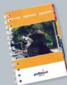
Agenda con información preventiva sobre Gas Natural para los 1350 Bomberos operativos del DF