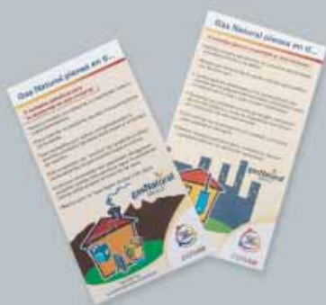
Campaña Uso Eficiente de la Energía GNM - CONAE