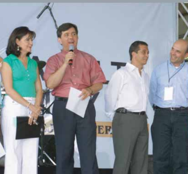
Momento de la entrega del Donativo, agosto 2005.

Donación para pisos de tierra y techos de lámina para viviendas de adultos mayores en situación de extrema pobreza.