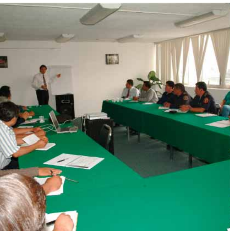
Jornada de Intercambio de la Gerencia de Distribución GNM con los Jefes de las 12 Estaciones del H. Cuerpo de Bomberos del Distrito Federal

Formación e intercambio de información en la Academia de Bomberos con los jefes de estación y responsables del manejo de materiales peligrosos del Cuerpo de Bomberos del Distrito Federal.