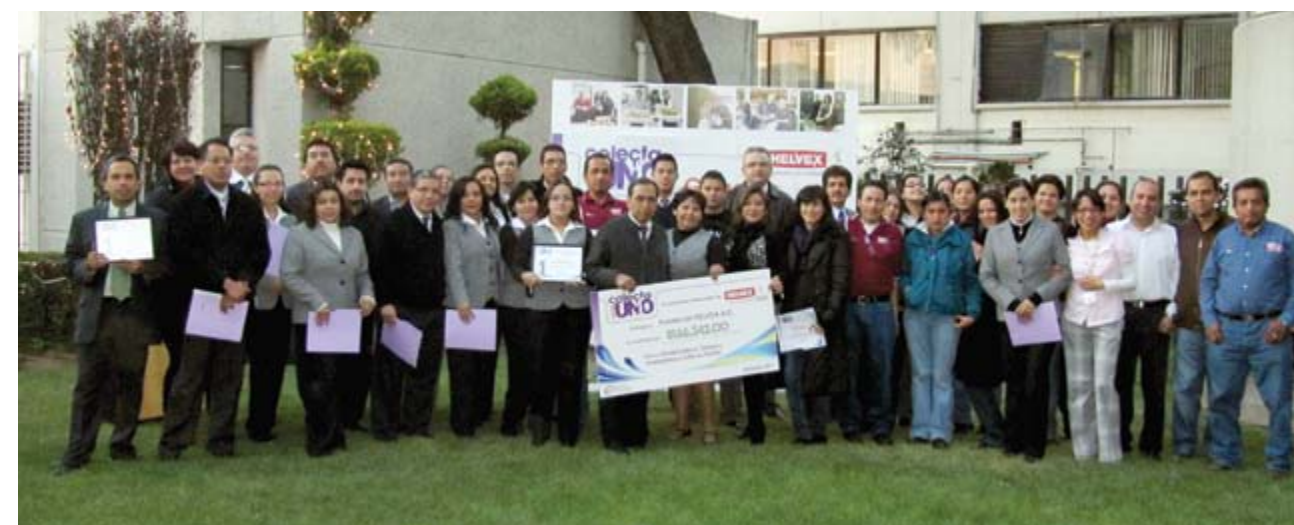
Colecta interna "más uno"

Las diferentes áreas que componen la organización, hicieron actividades variadas para lograr llegar a sus metas establecidas. Gracias a la COLECTA MÁS UNO , sumada a la aportación de la empresa Helvex®, se recaudó el monto equivalente a: 8 tratamientos anuales para niños del Teletón, 1,200 piezas de ropa en beneficio de 300 familias y víveres para la comunidad de Santa Catarina en Tabasco , afectada por las fuertes inundaciones.