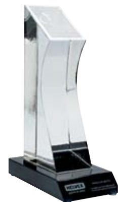
Premio Nacional de Tecnología

En el 2011, nos adherimos a The Global Compact , compromiso que refleja el apoyo a los 10 principios del Pacto Mundial de las Naciones Unidas a favor de los derechos humanos.