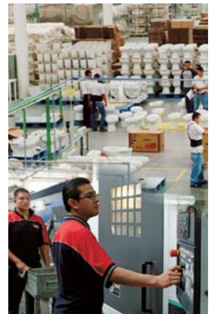
Grupo Helvex® en expansión

Helvex® cuenta con un gobierno corporativo integrado por el Consejo Directivo y la Asamblea de Accionistas. Basamos el actuar bajo el Modelo de gestión estratégica Helvex® que esquematiza el diagnóstico que la empresa lleva con sus grupos de relación (Clientes, comunidad, medio ambiente, proveedores, gobierno, organizaciones no gubernamentales, otras empresas y accionistas), la planeación estratégica, la ejecución de la estrategia, la generación de su propuesta de valor, las ventajas competitivas y el control de sus resultados.