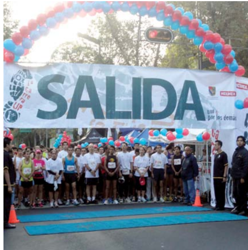
Carrera patrocinada por Helvex®, Fundación Helvex y el distribuidor Casa Polanco.

En este año, Fundación Helvex, E.A.C. tuvo una destacada presencia en EXPO CIHAC, siendo éste el foro nacional más grande e importante en la industria de la construcción, gracias a la donación del stand por parte de Helvex® y del espacio por los organizadores del evento, donde se ofreció información de los programas institucionales.