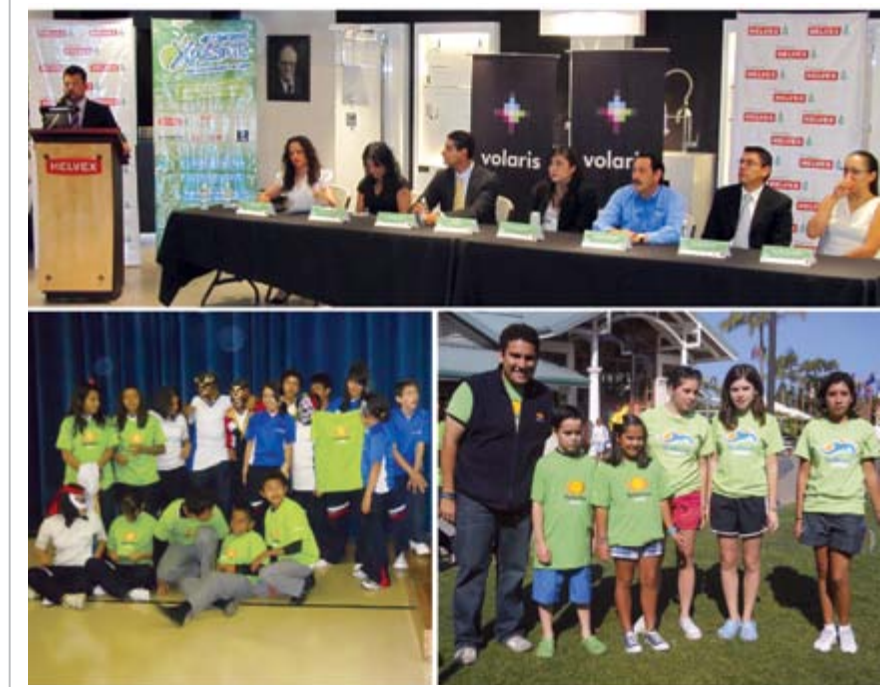
Ceremonia de premiación Concurso Xprésate; Ganadores exhibición Lucha libre y una visita a Sea World San Diego, California

Por cada participante, Fundación Helvex y sus aliados reforestaron un árbol. En este 2011, se tuvo la participación de 10,200 alumnos , misma cantidad de árboles reforestados en Sta. María Tlahuitoltepec Mixe, Oaxaca. A 4 años de implementación de este programa, se han reforestado 40 mil árboles en diversas partes de la República , contribuyendo así a las recarga de mantos acuíferos.