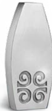
Premio a las Mejores Empresas

En cuestión ecológica, Helvex® Vallejo, renovó la Certificación de Industria Limpia otorgada por la Procuraduría Federal de Protección al Medio Ambiente por el cumplimiento de la normatividad ambiental.