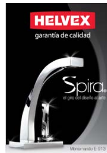
Publicidad Helvex® dentro del marco a la dignidad y al respeto humano