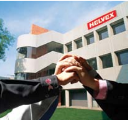
Calidad humana y desempeño

En Helvex®, se cuentan con políticas de no discriminación a empleados por ningún motivo tales como: edad, raza, género, orientación sexual, estado civil, creencia religiosa, tendencia política, nacionalidad ni discapacidad. Colaboradores