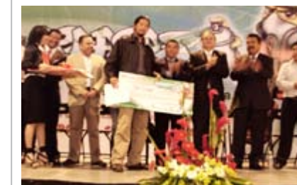
Ceremonia de Premiación "Unidos por el Agua"

Fundación Helvex A.C. incentiva el uso eficiente del agua a través de diversos programas dirigidos a la niñez y juventud mexicana contemplando de igual manera al rubro hotelero.