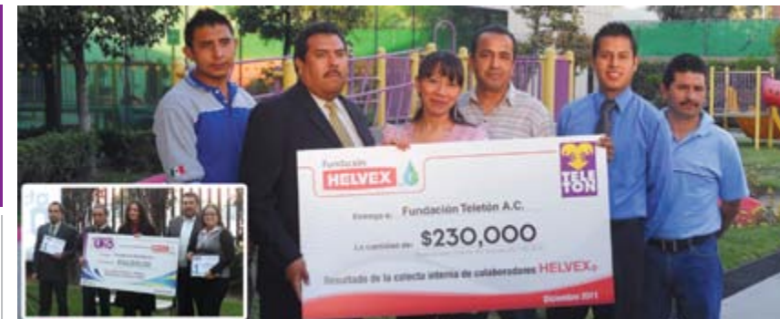
Patrocinios económicos para causas sociales

La calidad humana, es una virtud que resalta en los colaboradores de Helvex®. Al 2011 se llevaron a cabo actividades de diversa índole con la finalidad de poder ayudar ante llamados sociales.