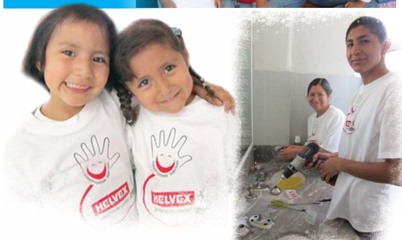
Jornadas de voluntariado para colaboradores Helvex®