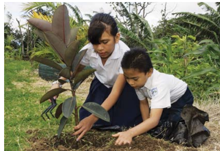
Alumnos de la escuela Brasil de Mora en actividad ecológica

Responsabilidad social más allá de nuestras fronteras