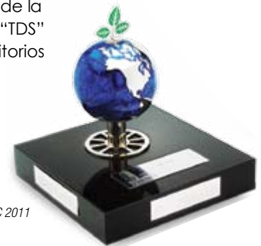
Premio ECO CIHAC 2011

Helvex® se hizo acreedor al Premio de la Innovación Sustentable ECO CIHAC 2011 que reconoció los beneficios y resultados de la Tecnología "TDS" para mingitorios secos.