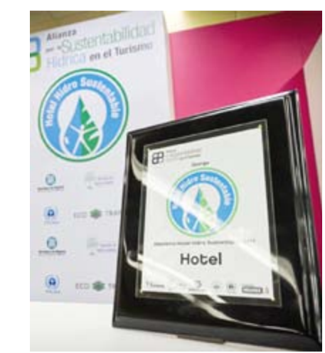
Placa conmemorativa "Distintivo Hotel Hidro-Sustentable"

la Ciudad de México , realizó el Foro "Hacia la Sustentabilidad Ambiental Hotelera" en el cual se les brindó a los empresarios y tomadores de decisiones del rubro hotelero de la Ciudad de México, conferencias y herramientas para potencializar su desempeño ambiental integral y con ello poder obtener el Distintivo Hotel Hidro Sustentable.