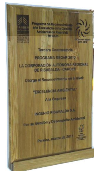
Foto: Reconocimiento REGAR

La CARDER mediante el REGAR, reconoce a las empresas de los sectores público y privado la gestión ambiental adelantada, orientada al uso racional de los recursos naturales y la adecuada gestión de residuos provenientes de sus procesos productivos. La vigencia del reconocimiento comprende los años 2010–2012.