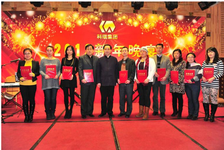
对年度优秀员工的表彰与奖励体现了科瑞集团对员工的关爱与鼓励

经过发展，科瑞集团的战略决策更加稳健、运作经营更加理性、制度管理更加规范、企业文化更加鲜明，明确了“诚信重义、合作共赢、坚韧执着、创新高效”的核心价值观，突出了科瑞集团重视人的品质磨练，关注人的发展的新企业文化理念。