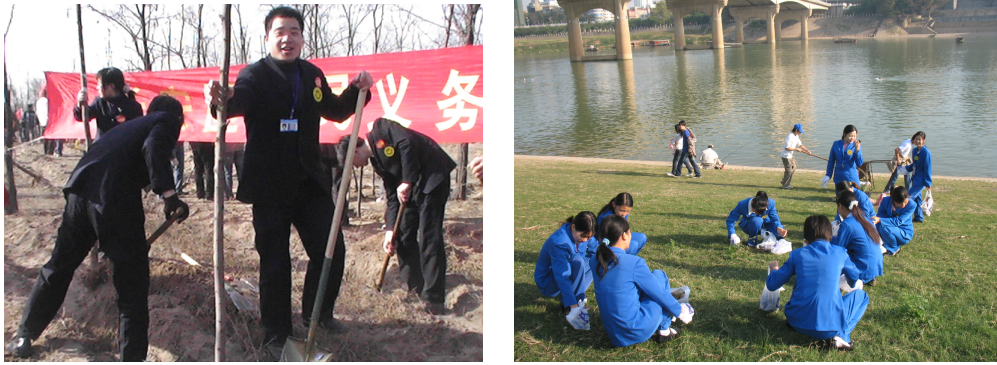
图 3-1 植树造林、城市环卫，“老百姓”积极履行对生态环境的职责