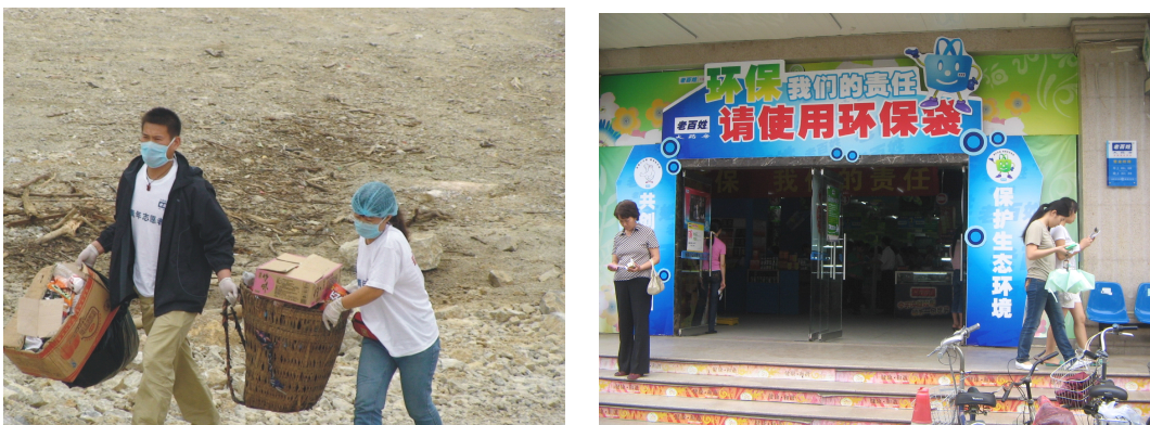
图 3-3 宣传环保理念促进市民加强环保

2008年5月，老百姓大药房开展了“老百姓环保总动员”活动，向消费者免费发放环保袋近16万个，总价值达48万余元。同年，老百姓大药房浙江公司开展环保袋设计大赛，让市民在参与活动的同时熟知环保知识，实践环保行动，传播环保理念。除此以外，各省公司门店也充分利用卖场终端的优势，向顾客宣传环保理念，开展系列环保活动，来带动顾客参与环保。而且，省公司经常性地组织员工清扫街道，打扫社区公共卫生、开展社区公益演出等形式来加强城市文明建设。