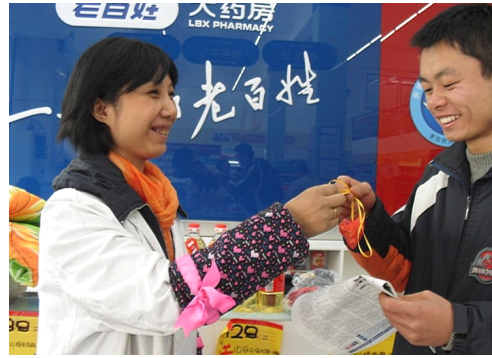
图 4-9 门店药师为公交司机送上防流感香囊

2009 年 10 月 27 日，老百姓大药房在湖南长沙发起成立了“老百姓爱心汇”公益组织，成为我国第一个自发进行造血干细胞知识宣传的药品零售企业。当天活动现场，由“老百姓爱心汇”发起的“义卖大比拼”和“造血干细胞志愿捐献”活动同期进行，老百姓大药房董事长谢子龙和公司其他 50 多名志愿者与现场群众一道加入了造血干细胞捐献者行列，很多员工更是在采集血样后现场献血。“老百姓爱心汇”成立后，每年将组织全国 400 多家门店开展 4000 多场爱心活动，并积极宣传造血干细胞捐赠活动。