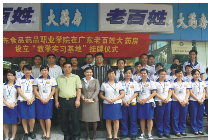
图 4-5 老百姓大药房与学校合作成立教学实习基地，吸纳学生实习就业

2011年1月11日，共青团湖南省委邀请了部分在湘的全国人大代表、全国政协委员、省人大代表、省政协委员以及新生代农民工代表共50余人，在我公司会议厅开展面对面沟通交流活动，探讨并了解新生代农民工的诉求，热议新生代农民工融入社会的问题。