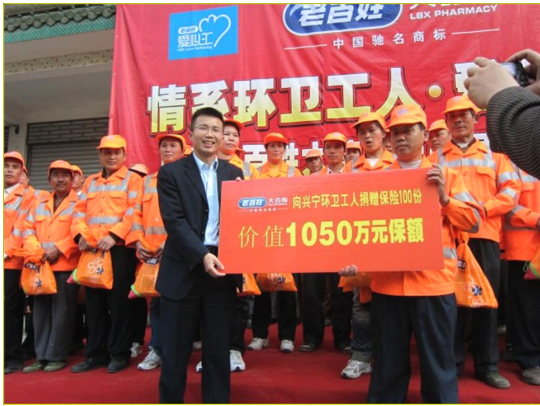
广西公司为环卫工人捐赠人身意外伤害保险

2011年12月20日，老百姓大药房广西公司员工代表慰问广西南宁市兴宁区环卫站100名环卫工，并为他们捐赠了价值1050万元的人身意外伤害保险保额，送上一份浓浓的爱心！