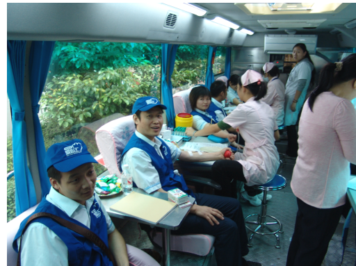
图 3-6 “老百姓”员工积极报名捐献造血干细胞

2011 年 7 月 15 日，老百姓大药房陕西公司携手西安公交五公司，捐赠总价值万余元的流动药箱，为西安“世园会”游客献爱心。