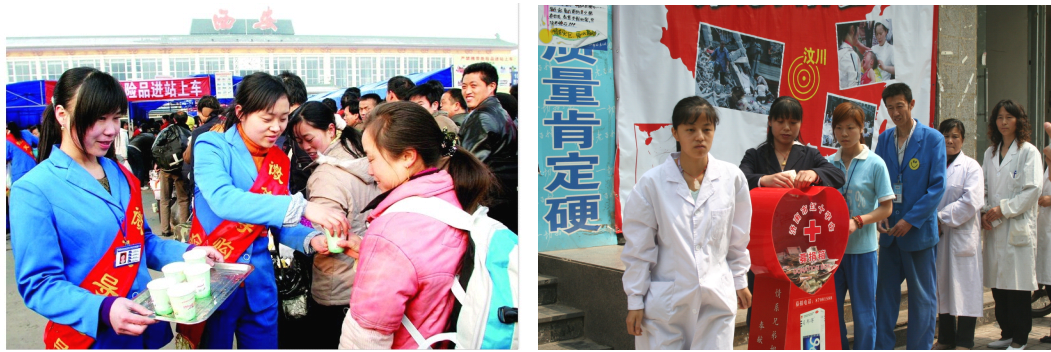
图 4-3 寒风中送温暖，流动在各大车站的老百姓人 图 4-4 抗震救灾“老百姓”积极参与救灾行动

2008年5月，汶川地震发生后，老百姓大药房董事长谢子龙紧急中断在外地的商务活动连夜赶回长沙总部，并在第一时间指示公司紧急调集价值500多万元的灾区急需药品，派出由公司专业医护人员组成的“青年志愿者救护队”，护送急需药品奔赴灾区一线参与救援。同期，由公司董事长带头的捐款活动纷纷在总部及各省公司开展，集团共向灾区捐款116万余元。在公司内部，也紧急启动了“老百姓大药房千万困难救助基金”，帮助四川、陕西籍受灾员工渡过难关。