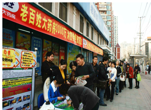
图 4-6 市民排着长队领取免费购药券

2009 年 3 月，即将成立的老百姓大药房江苏公司，在获悉受金融危机影响，很多低保户及下岗职工看病贵吃药难的情况后，立即与街道实行政企对接，开展了“55 万元帮扶 5500 户困难家庭”的爱心行动，赢得了社会的广泛好评。