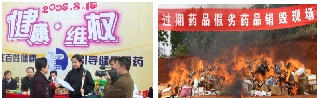
图 3-2 过期药品回收及销毁大行动

另外，公司也经常通过晚会、活动、图片展等形式向消费者面对面地宣传节能环保知识和安全合理用药常识。例如各省公司每年都开展的“过期药品回收”活动，为防止过期药品重新流入社会危害群众健康或因随意丢弃而污染环境，老百姓大药房每年都会投入大量资金，制作海报在门店和社区宣传栏进行张贴，号召市民合理购药以免浪费，并对过期药品进行回收。在门店服务中心，设立了过期药品回收点，对顾客的过期药品进行回收，并根据药品价格水平兑换相应的礼品或现金券。公司每年都会回收上十吨的过期药品并联合各地政府监督部门一起进行销毁，每年投入到过期药兑换新药或现金券活动的费用就达 200 余万元。