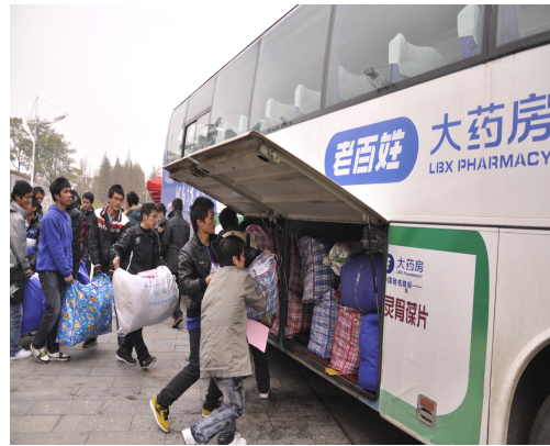
“爱心大巴”满载爱心为孩子们送去温暖