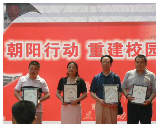
图 4-2 爱心茶叶义卖，老百姓大药房认购 1 万元