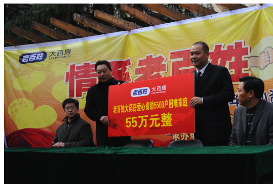
图 4-7 爱心资助 5500 户困难家庭捐赠现场

2009 年 4 月，流感快速传播，老百姓大药房立即在全国发起预防甲流系列活动——制作了 40 万份抗流感宣传页在全国门店免费派送，并为顾客免费派发中药凉茶、口罩、板蓝根等，制作了抗流感海报在门店及社区宣传栏进行张贴，提醒市民养成“勤洗手、多通风、少扎堆”的良好习惯，有效预防甲流传播。