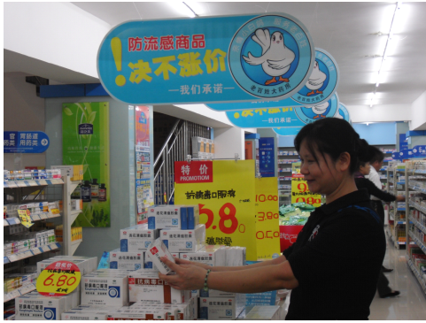
图 4-8 流感期间，抗流感药品绝不涨价