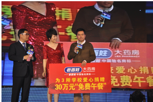
“老百姓”爱心捐赠30万元“免费午餐”

陕西回归研究会儿童村是全国第一家专为在押犯遗留的未成年子女提供免费代养代教服务的民间慈善机构，其经费大多来自国际慈善机构及社会捐助。老百姓大药房陕西公司自2005年起，就一直对该机构进行爱心援助。2011年10月27日，老百姓大药房全国管理机构的员工自发组织，筹集了15765元的爱心善款捐赠给陕西回归研究会儿童村，为孩子们提供生活和学业上的帮助。