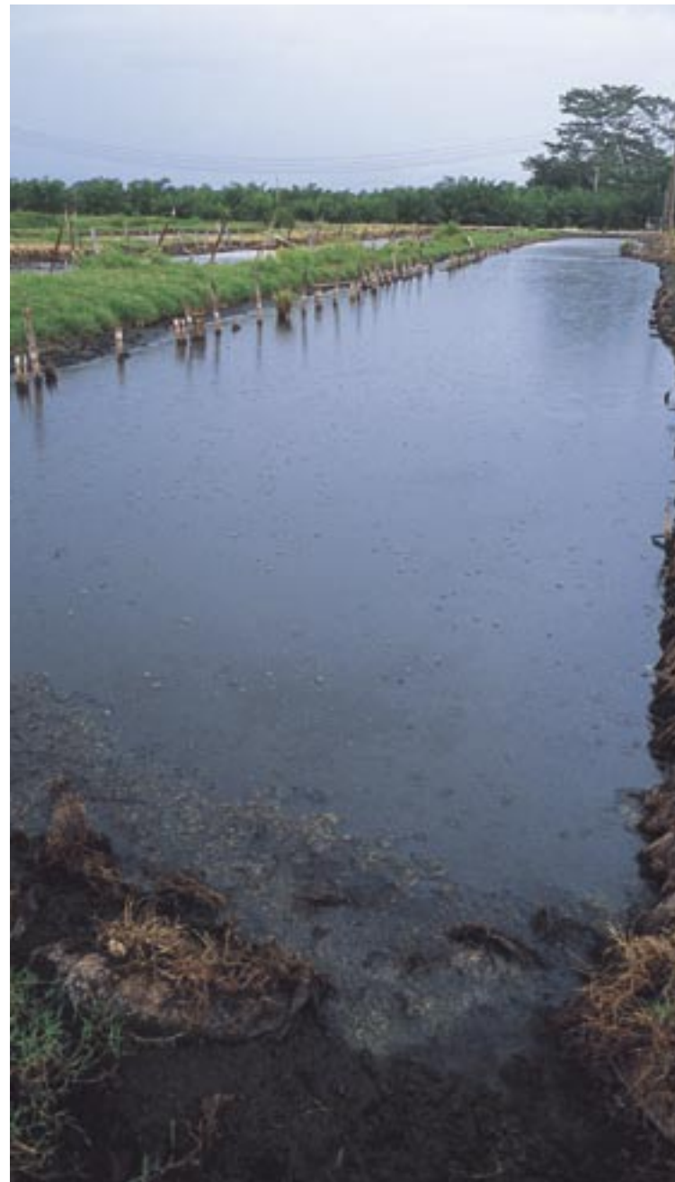
Lagunas de oxidación.

Durante el proceso productivo no se adiciona ningún producto químico, y los subproductos resultantes como fibra, tusa, cascarilla, se emplean