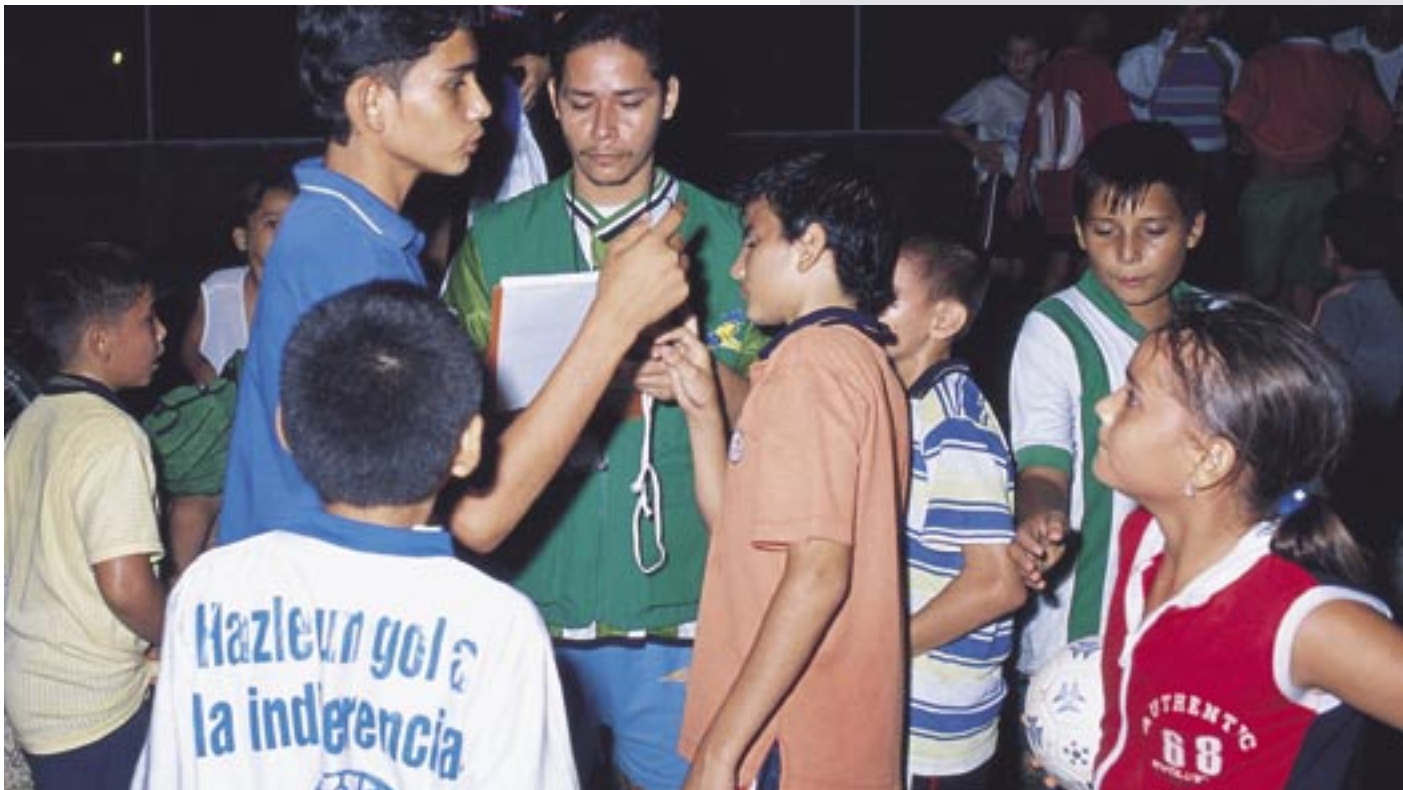
Entrenadores y jugadores de Fútbol por la Paz.

“Tratarnos bien con los amigos...no pelear...no decir groserías en el partido...ser buenos amigos...tener buenas amistades...no pegarle duro a las mujeres. Eso hemos aprendido en Fútbol por la Paz”.