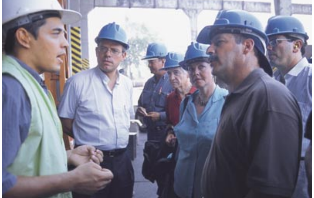
Técnicos y funcionarios en la planta extractora.