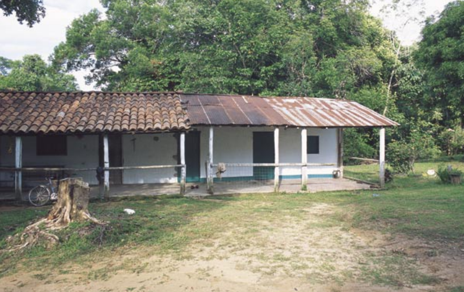
Casa de la Hacienda El Palmar.