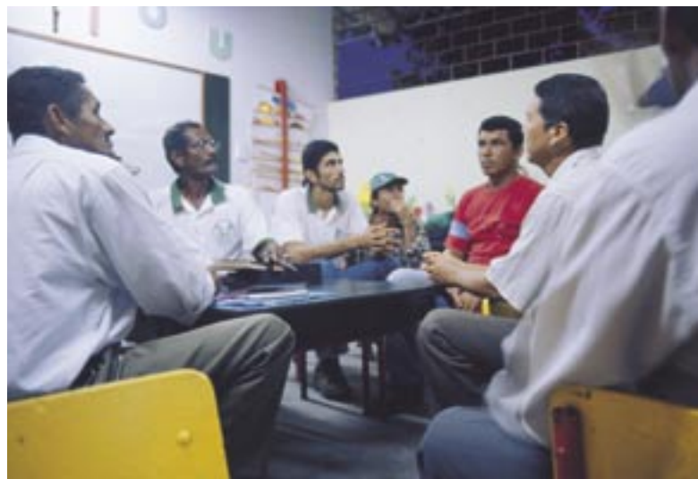
Cooperativos propietarios debaten sobre un proyecto de crédito en un salón del Colegio de Indupalma.

La Cooperativa El Futuro orgullosamente reunida en su sede. Además de prestar servicios agronómicos, tiene una fábrica de guantes.