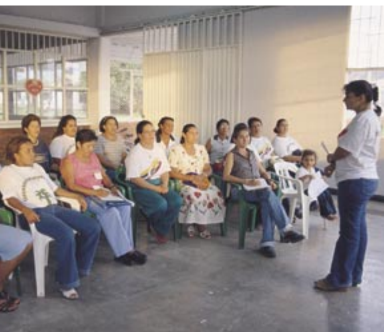
El grupo de mujeres en una sesión del programa ANSPAC.