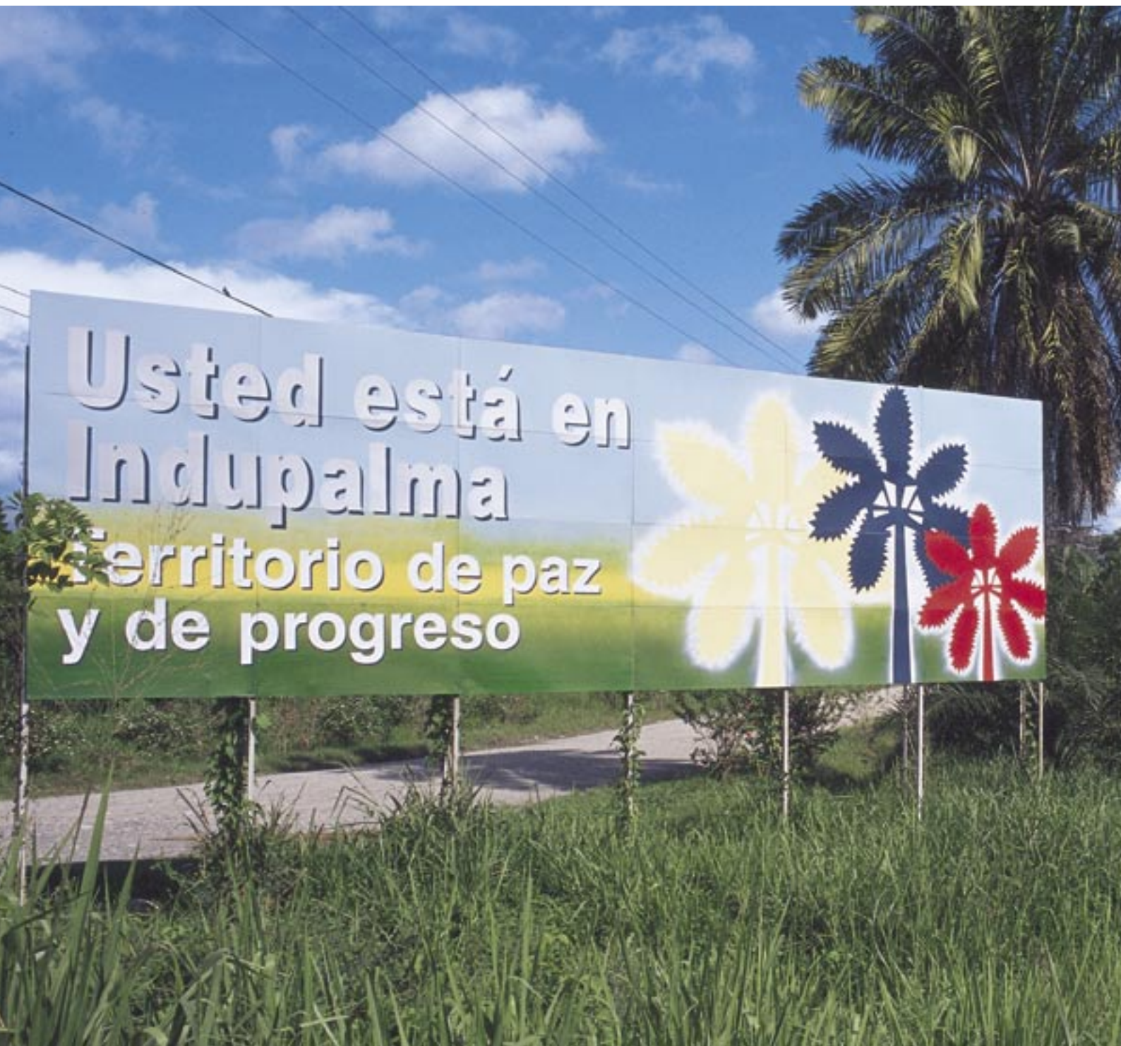
Valla que marca la entrada a la plantación en San Alberto.