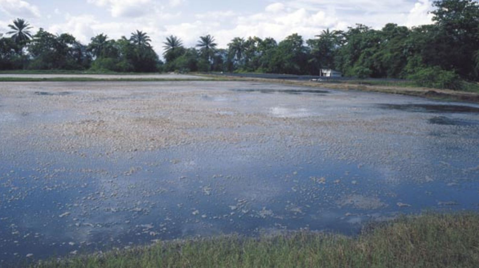
Laguna de oxidación en la plantación.

para aportar nutrientes al suelo en el campo, o como combustible para las calderas que generan el vapor necesario para el proceso.