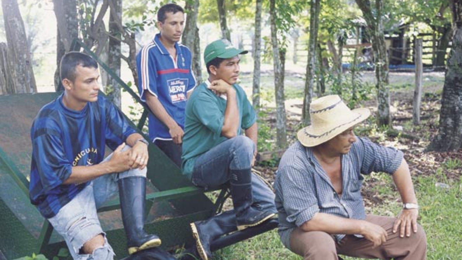
Un grupo de Cooperativos en su hacienda.