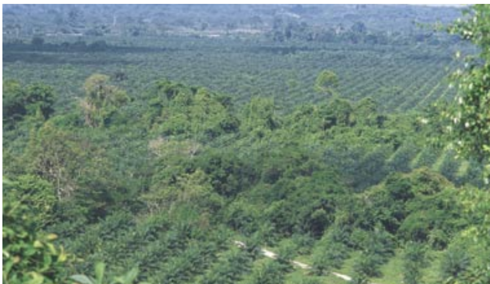
Panorámica del cultivo de la hacienda El Palmar