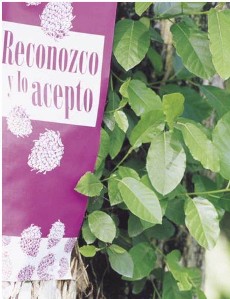
Afiches de la campaña de comunicación se colocan también en algunos troncos de los árboles.

El clima de violencia que ha vivido la comunidad de San Alberto ha dejado secuelas de miedo, inseguridad y desconfianza que Indupalma no podía ignorar, si quería llevar a cabo con éxito sus procesos de cambio. De ahí el énfasis y la persistencia en romper esa barrera con novedosas estrategias de comunicación que dieran vía libre a la claridad, a la verdad y a la comprensión en terrenos de confianza.