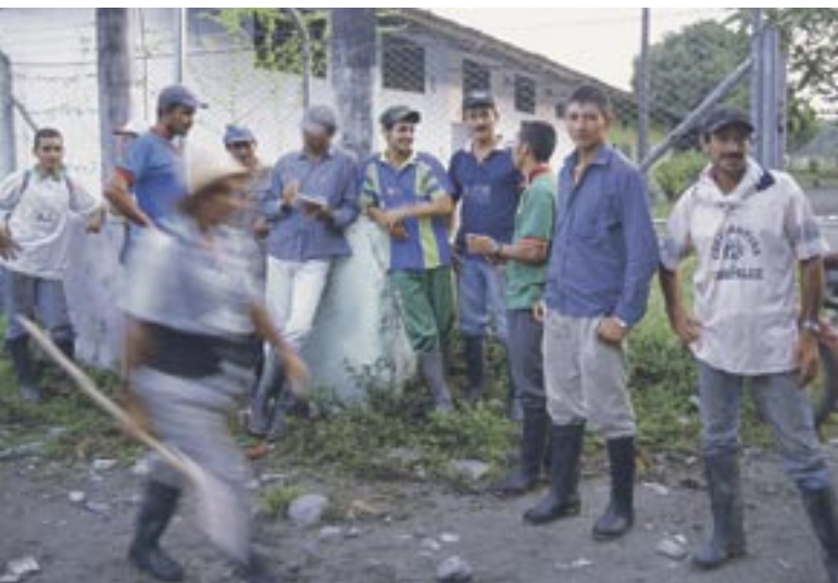
A las 6 de la mañana los cooperativos preparan su herramienta y sacan los búfalos para hacer su trabajo agronómico.