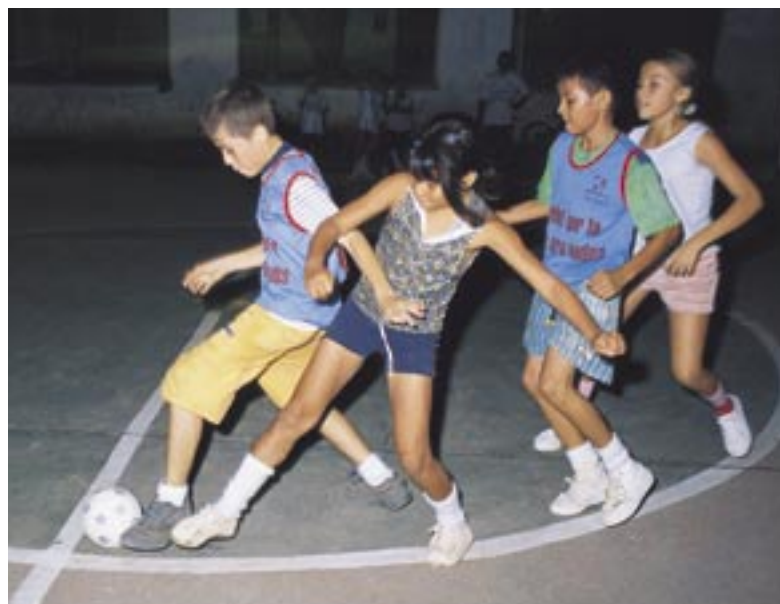
Hacia las siete de la noche varias canchas de fútbol de San Alberto se llenan con los jugadores de Fútbol por la Paz.

Otro aspecto novedoso, pero necesario para los fines de convivencia pacífica que se persiguen con este programa, es que la figura del árbitro se reemplaza por la del asesor, quien solamente actúa como