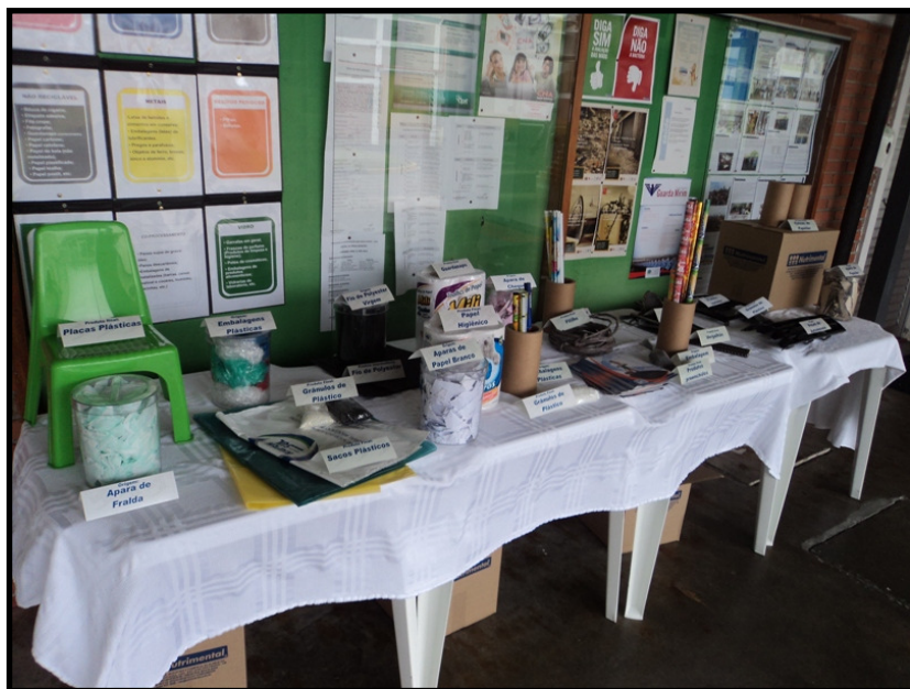
Exposição de materiais reciclados