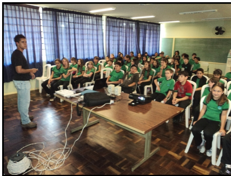
Palestra realizada pelos colaboradores da Nutrimental na escola Pe Arnaldo Jansen

"O nosso planeta está passando por várias mudanças, tudo porque não estamos sendo cuidadosos com ele (...) Um dia nós iremos parar e pensar: Por que fizemos isso, esse lugar era tão lindo? Por isso, vamos fazer a nossa parte!! Vamos diminuir nosso tempo no banho, não vamos mais jogar papel no chão e sim na lixeira, vamos separar o lixo reciclável do orgânico (...) Pois são pequenas ações que um dia farão a diferença." (aluna de 7º série do Colégio Pe Arnaldo Jansen).