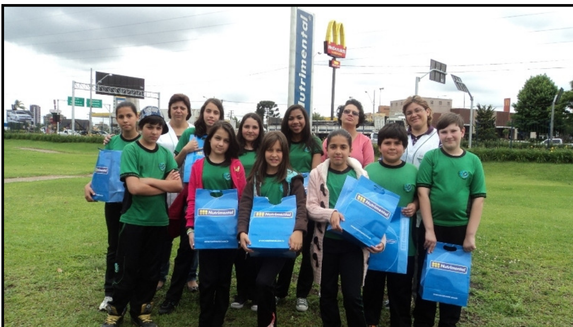
Vencedores do concurso de redação e seus professores no dia da visita à Nutritional