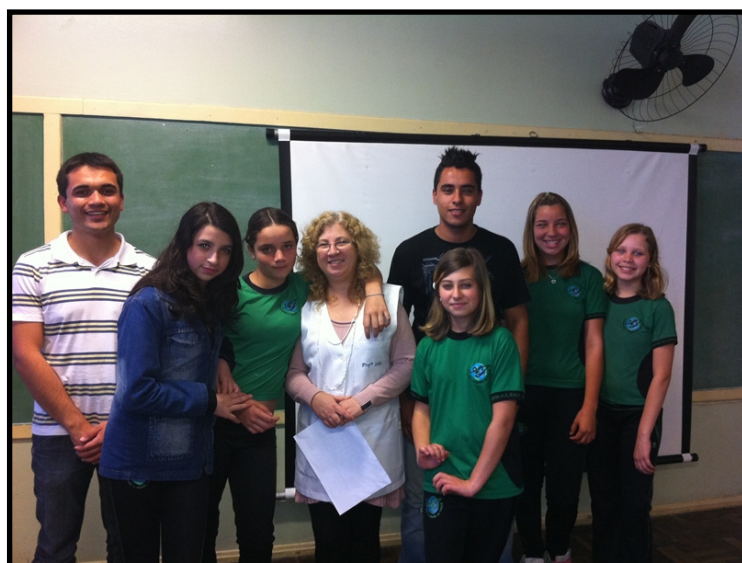
Dois colaboradores da Nutrimental com os alunos e professora da escola