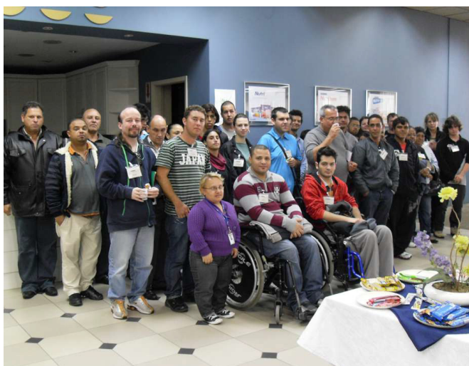
Treinamento realizado para pessoas com deficiência