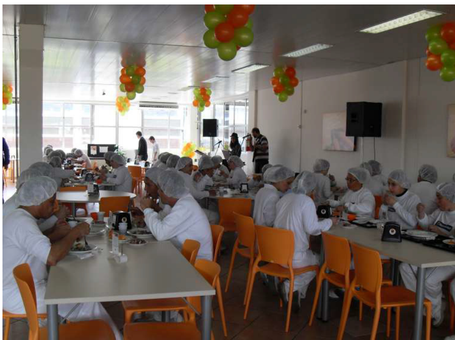
Reinauguração do refeitório após obras