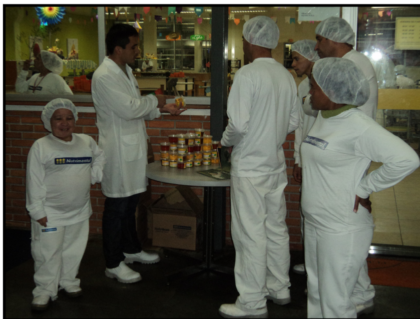
Entrega de sabão feito a partir de óleo vegetal

Outra ação da empresa que também teve como objetivo apoiar uma abordagem preventiva aos desafios ambientais foi a criação de um grupo multidisciplinar e voluntário para tratar de questões ambientais. O grupo chama-se Grupo Força Ambiental (GFA) e tem como objetivos: