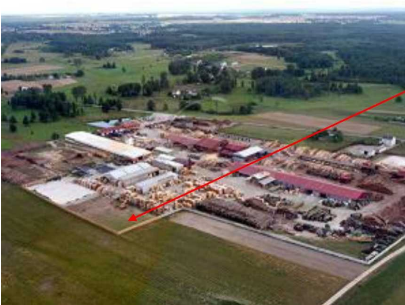
Lokalizacja budynków EC