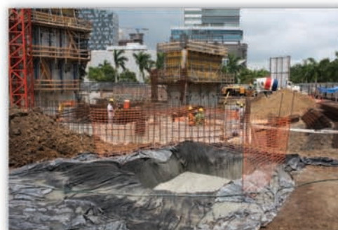
Tinas de lavado de concreto

Certificación LEED para eficiencia energética emitida por el United States Green Building Council, firma de manejo y administración de edificios.