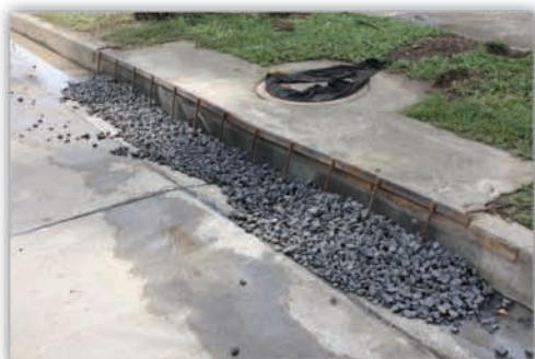
Control de sedimentos