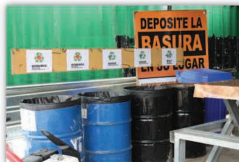
Manejo de desechos