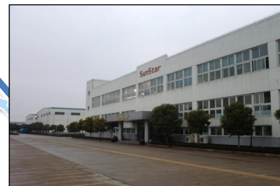
[중국 임대 공장-증설예정]