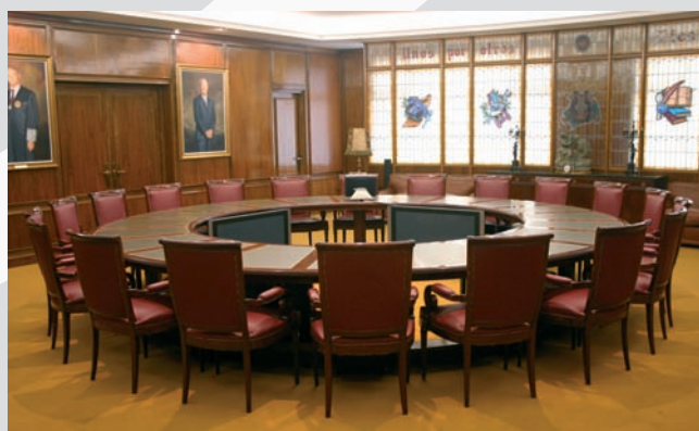
Sala del Consejo de cajacirculo

Los vocales del Consejo de Administración serán elegidos por la Asamblea General entre los miembros de cada grupo, a propuesta del grupo respectivo.