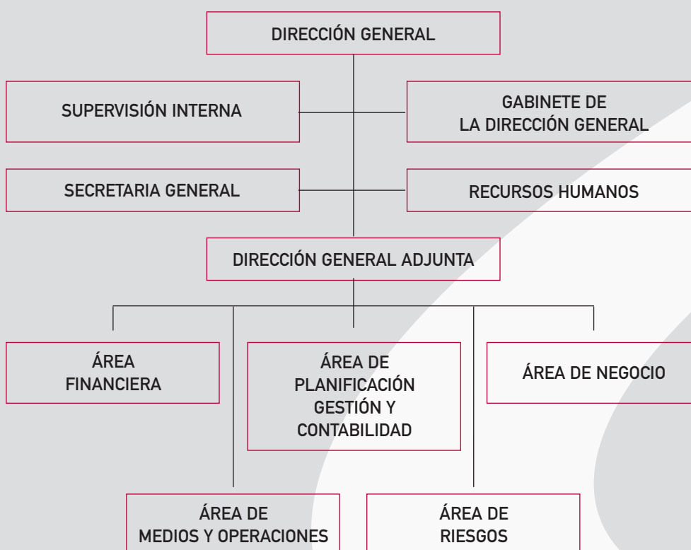
Estructura Ejecutiva de caja círculo (2.3)