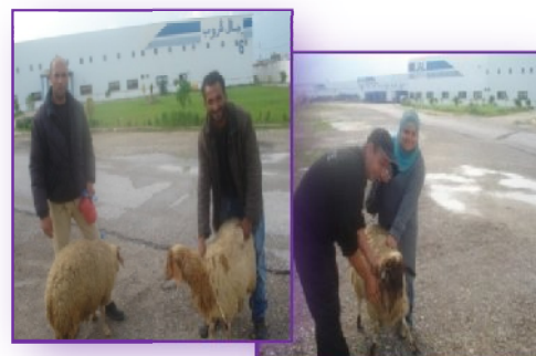
Figure n°12 : Distributions des dons de mouton au profit des employés de JAL GROUP Tunisie.

▪ Dans un contexte de promotion de solidarité et de renforcement des liens entre les employés JAL GROUP Tunisie ne s'absente pas de faire plaisir et participer ses employés à la joie de la fête d'AID EL IDHA, elle a offert des moutons comme des dons pour cette grande occasion aux familles les plus pauvres et nécessiteux et cela en coordination avec la commission consultative de JAL GROUP Tunisie, partenaire de dialogue social dans l'entreprise. La raison de JAL GROUP est de ne pas faire priver ou négliger ses employés de sentir la joie de cette fête.