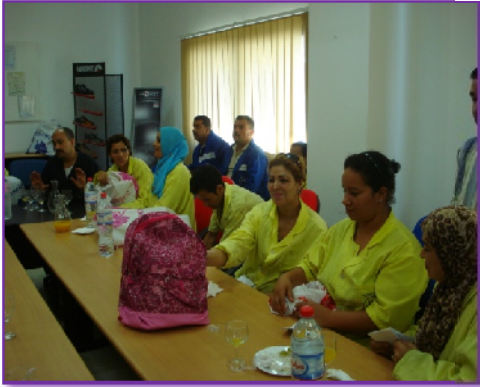
Figure n°11 : Distribution des cartables et fournitures aux profits des travailleurs de JAL GROUP Tunisie.