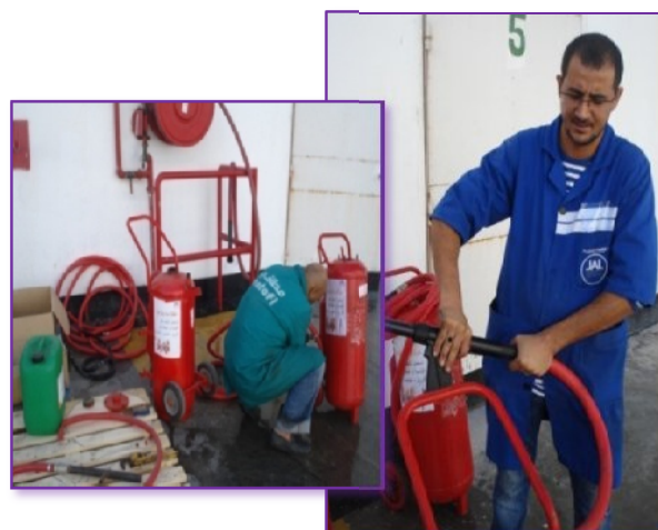
Figure n°4 : Entretien des extincteurs et vérification des équipements de sécurité.