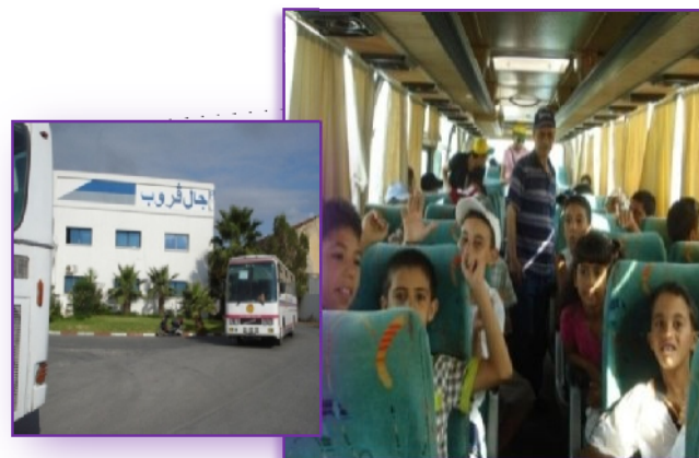
Figure n°10 : Des excursions au profit des enfants des travailleurs.

▪ Toujours dans le même cadre, l'entreprise accorde des primes de rendement semestrielles par des opérateurs qui travaillent par poste et des primes d'assiduité également pour les postiers. ▪ Durant le mois de juillet notre société à Organiser une excursion au profit des enfants des travailleurs à destination d'Hammamet ville touristique à Tunis cette initiative vise à permettre à ces enfants de découvrir leur pays et crée un climat d'amitié entre les enfants de nos employés (Voir figure n°10).