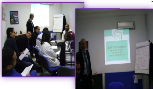
Figure n°7 : Formation sur le Système de management de la Santé et de la Sécurité au travail

Le Système de Management de la Santé et de la Sécurité au travail selon le référentiel « OHSAS 18001 » version 2007, de même une autre formation intitulée « ISO 9001 Version 2008 » qui a touché la totalité des pilotes processus des trois sites du groupe. (Voir figure n°7)