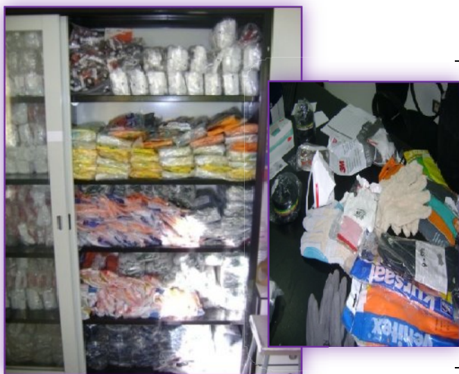
Figure n°1 : Disponibilité des équipements de protection individuelle (EPI)