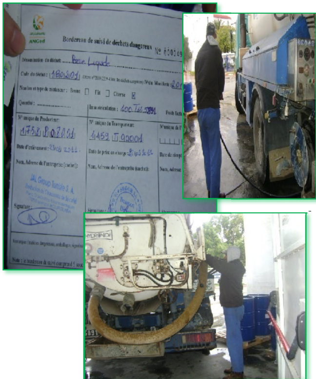
Figure n°2 : Transport des boues de station dépuración (déchet dangereux) par la société SEGOR

o Les déchets générés par JAL GROUP sont collectés dans des bennes suivant un tri sélectif et régulièrement pris en charge par des sociétés de récupération et de traitement autorisées ou stockés sur place dans l'attente de la prise en charge par le Centre de Jradou. Pour certains types de déchets (boues de la station dépuración et recyclage des eaux industrielles) des manifestes sont établis avec l'ANGED. (Voir figure n°2)