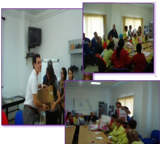
Figure n°9 : Distributions des dons scolaires et ordinateurs portables pour l'année scolaire 2011-2012

▪ L'accompagnement des enfants des ouvriers ne s'arrête pas au soutien de la rentrée scolaire car le Groupe offre aux écoliers un accompagnement durant toute l'année scolaire à travers l'organisation des cours particuliers assurés par les meilleurs enseignants locaux afin de les aider à améliorer leurs résultats scolaires. A la fin de l'année JAL GROUP offre des ordinateurs portables pour les inciter à fournir d'avantage d'effort dans leurs études (Voir figure n°9).