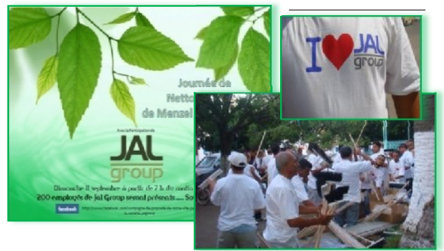
Figure n°6 : Employés de JAL GROUP Tunisie à la journée de nettoyage à Menzel Bourguiba

Cette action, entre dans le cadre de l'année internationale de la jeunesse, et viendra sauver l'environnement de la ville qui a été touché par la dégradation et le délabrement par faute de moyens nécessaires à remédier à cet état. JAL GROUP a constitué une dynamique groupe pour planifier et diriger cette action de propreté. L'objectif principal de cette "Opération de nettoyage" de grande envergure est de faire retrouver l'éclat de la ville de Menzel Bourguiba.