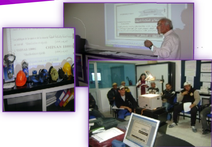
Figure n°5 : Formation de sensibilisation sur les nouveaux Equipements de Protection et Individuelle (EPI) et sur la politique santé sécurité au travail et environnement

JAL GROUP Tunisie organise aussi à son personnel administratifs, et aux responsables de production des formations internes, sous l'assistance des consultants et des auditeurs tierces parties ; cette formation à été réalisé durant le mois de Mars 2011 et s'est étendu durant 3 jours portant sur :