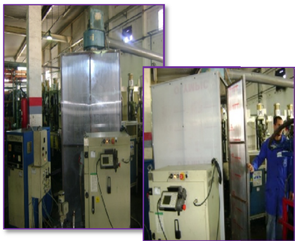
Figure n°3 : Encoffrement par le plexiglass des cabines des robots distaccanti.