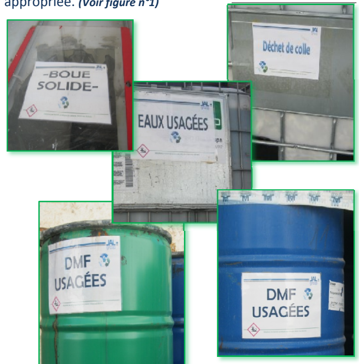
Figure n°1 : Identification de stockage de déchets dangereux

JAL GROUP veille à minimiser ses déchets dangereux en raison de leur dangerosité pour l'environnement (à court, moyen ou long terme, via leurs effets directs ou indirects sur tout le système l'environnemental), ils sont collectés, transportés et traités de manière appropriée. (Voir figure n°1)