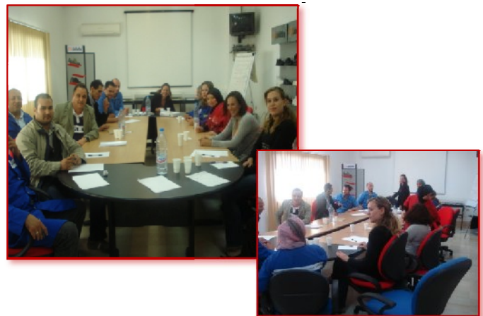
Employés de JAL GROUP Tunisie au cours de la formation