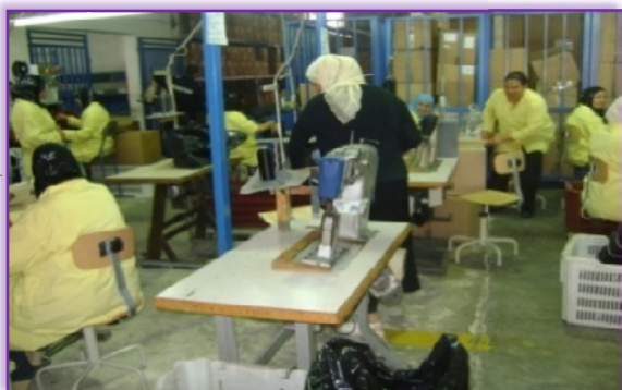
Figure n°2 : La disponibilité des chaises ergonomique dans divers départements de JAL GROUP Tunisie.