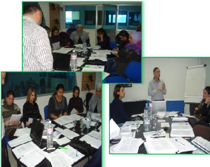
Figure n°5 : Formation en intra-entreprise : Réglementation environnementale et réglementation sécurité et santé au travail