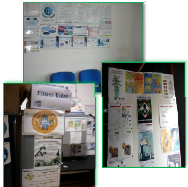
Figure n°4 : Tableaux d'affichages (JAL COMMUNICATION)