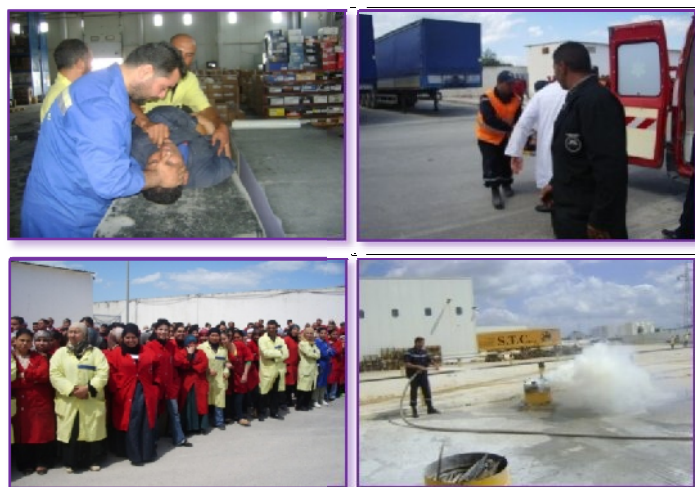
Figure n°8 : Organisations des opérations blanches avec l'intervention de la protection civil.

L'ensemble de notre personnel à été recyclé et formé à l'application des bonnes pratiques préventives, ceci essentiellement par des opérations blanches organisées officiellement et avec l'intervention de la Protection Civile, dans tout les sites du groupe (Voir figure n°8).