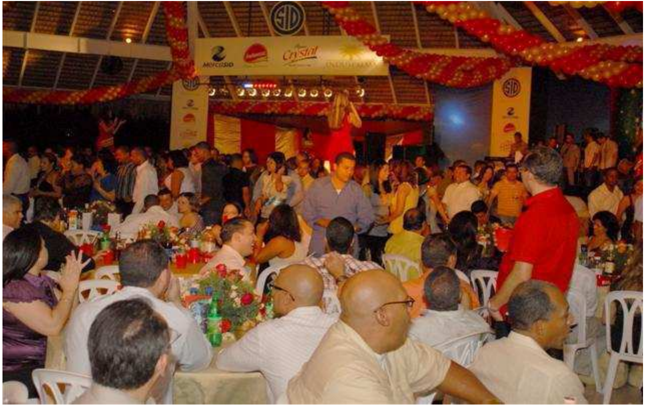
Fiesta de Navidad