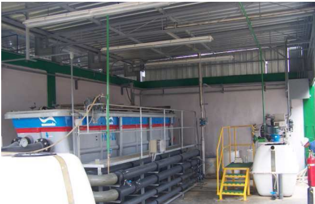
Vista General del área de DAF y Estación Polímeros