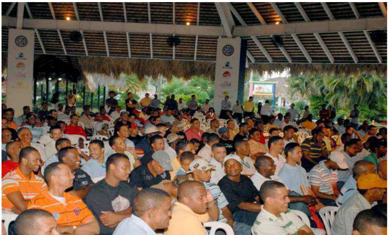
Día del Padre