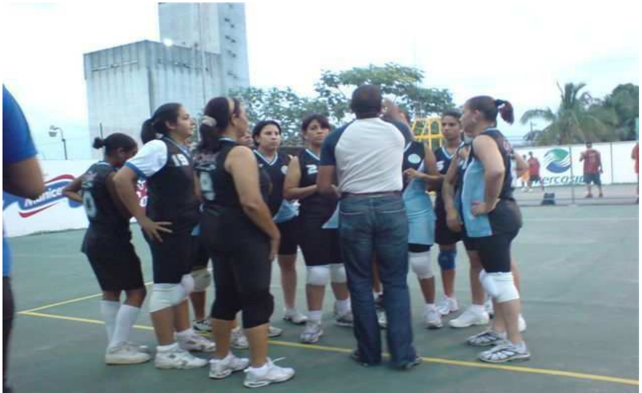
Torneo invitacional de Voleibol y Baloncesto 2008