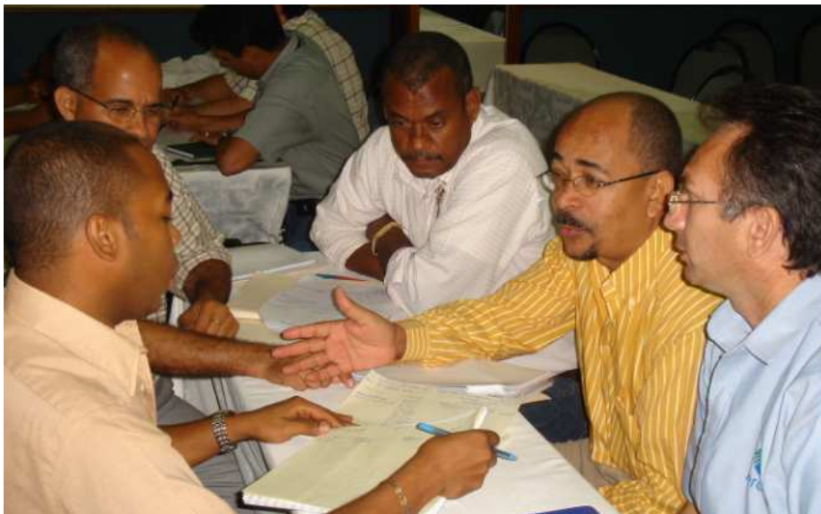
Participación durante jornadas / talleres Ambientales