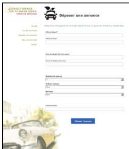
page d'accueil du site de covoiturage