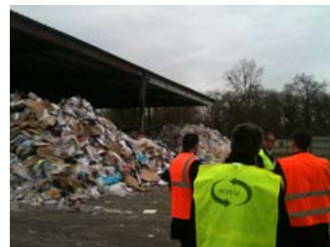
Visite de l'entreprise SCHROLL

La chaire de Développement Durable de l'école est centrée sur les débats qui correspondent à une meilleure adéquation entre le développement économique, la compétitivité, la protection de l'environnement et les conditions de travail.