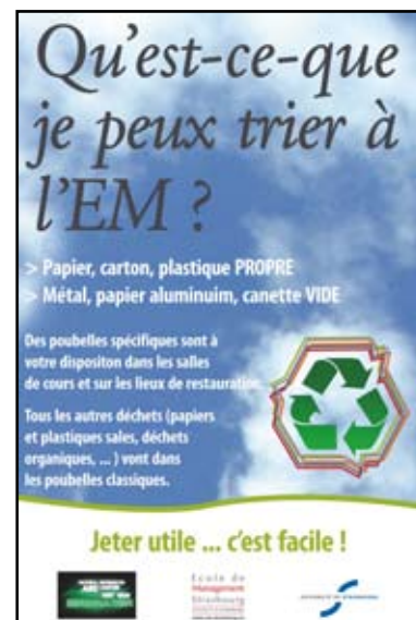
affiche «tri des déchets»