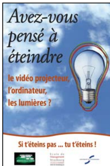
affiche «économie d'énergie»