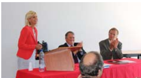
Signature de la convention avec SPIE Est