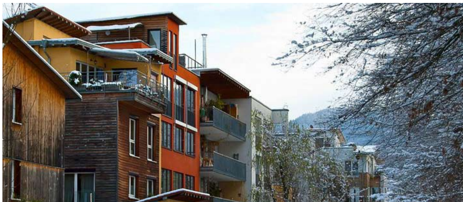
L'éco-quartier de Fribourg

> Le B3D a organisé une visite de l'un des plus anciens et des plus grands éco-quartiers d'Europe.