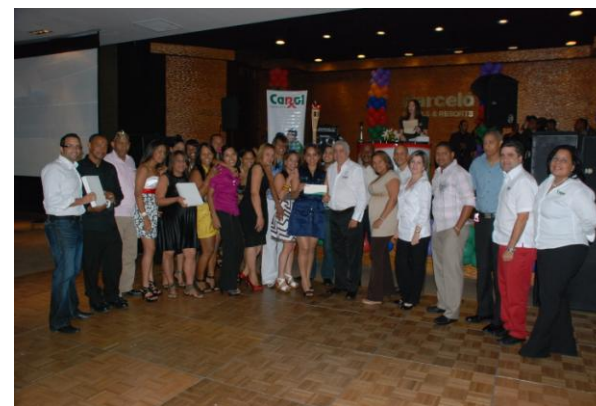
Premiación cuatrimestral de desempeño