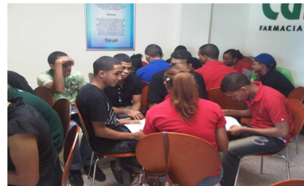
Empleados participando en capacitación.