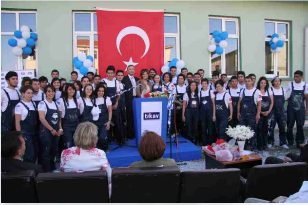
Mahmudiye İlköğretim Okulu 1. Kısım binasının onarımı bittikten sonra.