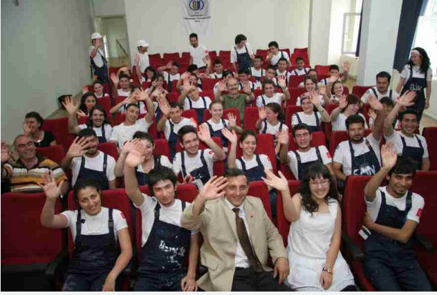
Mahmudiye İlköğretim Okulu 1. Kısım binasının onarımı sırasında.