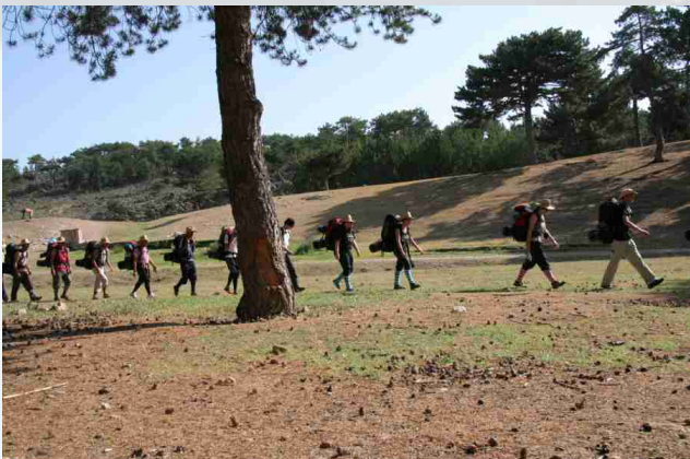
Frigya Vadisi kamp sırasında.

Toplumsal Uyum Projesi kapsamında Mahmudiye İlköğretim Okulu I.Kısım binasının onarımı yapılmış sonrasında Frigya Vadisinde 3 gece 4 gün yürüyüş ve dağa kampı gerçekleştirilmiştir.