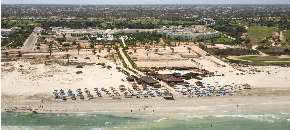
Hôtel Yadis Djerba Golf Thalasso & Spa

Récemment, l'hôtel YADIS DJERBA a obtenu l'écolabel « Pavillon Bleu », pour sa plage, une récompense qui symbolise de plus la qualité environnementale exemplaire de notre unité.