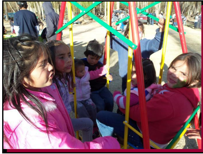
Pequeños niños felices de recibir regalos en su día.