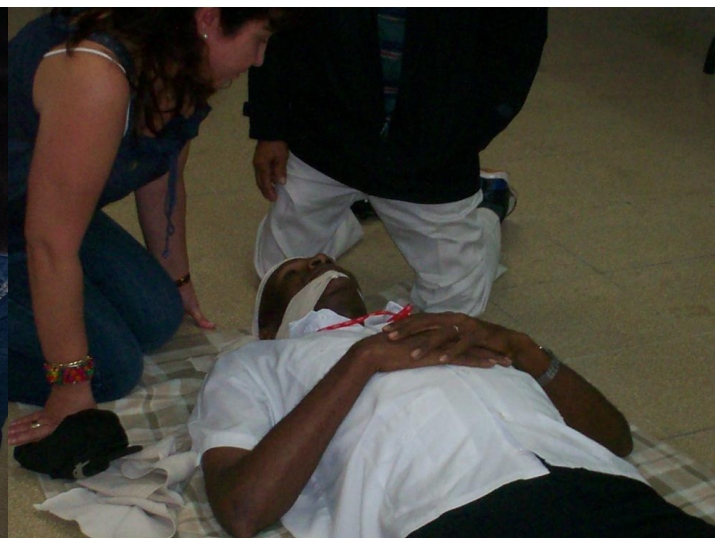
► Plan de capacitación enfocado exclusivamente en la prevención de riesgos.