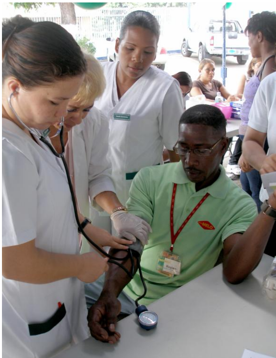
► Feria de La Salud - Empacadora Avícola