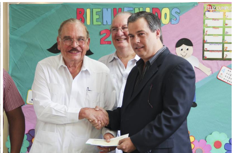
► Grupo Melo donó a la escuela Domingo F. Sarmiento un aula completamente nueva y equipada.