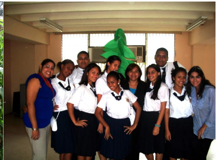
► Apoyo con el huerto en la escuela Juan E. Jiménez de Cerro Azul. ► Colaboradores de Grupo Melo dictan charla a estudiantes graduandos del IPT de Juan Díaz.