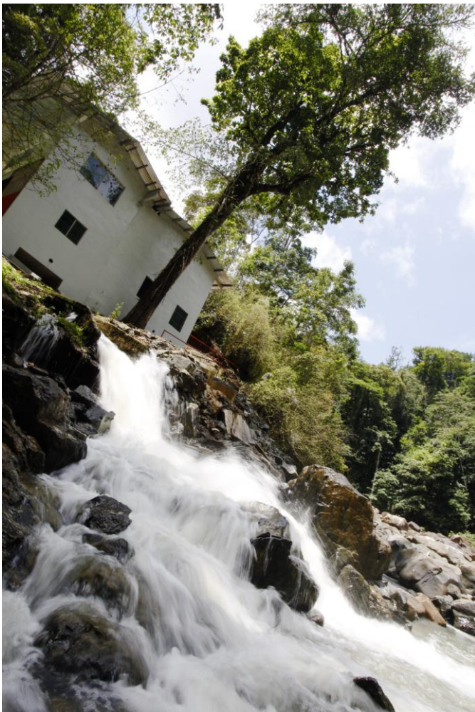
► Hidroeléctrica ubicada en Cerro Azul.