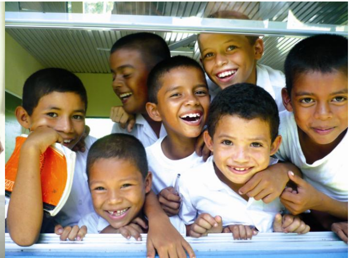
► Donación de útiles escolares en las escuelas El Picacho (San Carlos) y El Arenal (Darién)