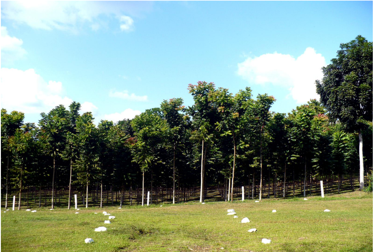
► Se sembraron 74,000 pinos caribe en los Altiplanos (Corregimiento de Cabuya, Antón)