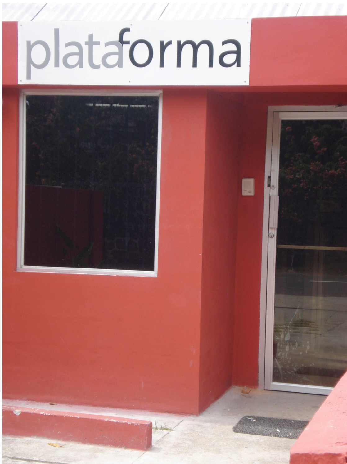
Boutique de Comunicaciones