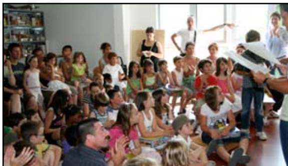
Remise de prix du concours de dessins à Villeneuve