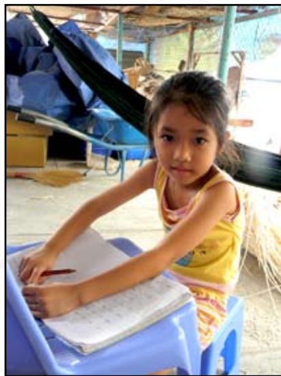
Petite fille faisant ses devoirs dans l'atelier où travaillent ses parents

terre d'Oc finance également l'assurance-maladie pour tous les ouvriers qui travaillent pour l'activité terre d'Oc, ainsi que des bourses scolaires, coûteuses au Vietnam (environ 19 € par an/enfant) que des familles pauvres ne peuvent pas financer. Assurer un travail aux parents et le meilleur moyen d'accès à l'éducation, et permet ainsi de lutter contre le travail des enfants (interdit en dessous de 15 ans).