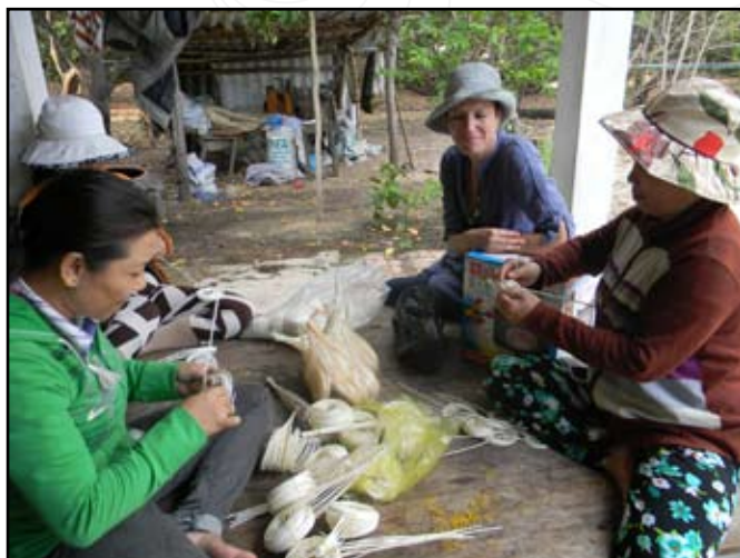
Fabrication de spirales en rotin

Fin 2009, terre d'oc a financé 1 000 plants de poivriers qui ont été distribués à 2 fermiers qui possèdent les plants de Long Muc, arbre à encens. Les poivriers ont besoin d'un support pour croître et le Long Muc est l'arbre traditionnellement utilisé à cet effet. Le Long Muc pour sa part bénéficie d'une protection au soleil grâce au feuillage. Hélas en 2010, un paysan pilote a interrompu la culture à cause de la sécheresse car il n'avait aucun accès à l'eau. Pour l'autre paysan qui possède 600 plants, il faudra attendre 3 ans pour la première récolte du poivre.