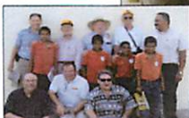
Members of the Tampa Rotary Club with several of the children of the Cigar Family School.