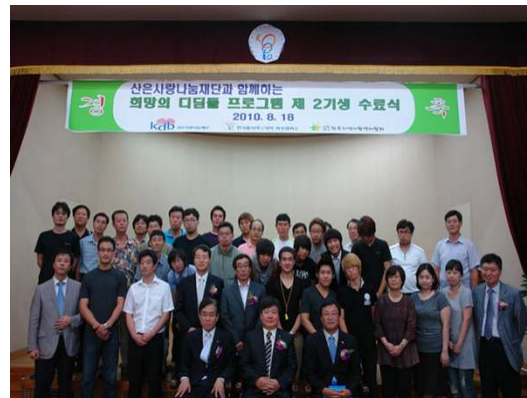
희망의 디딤돌 수료식