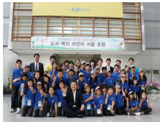
도서벽지 어린이 초청행사