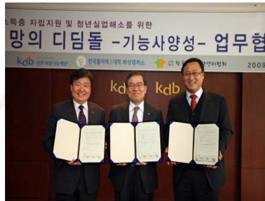
희망의 디딤돌 업무 협약식