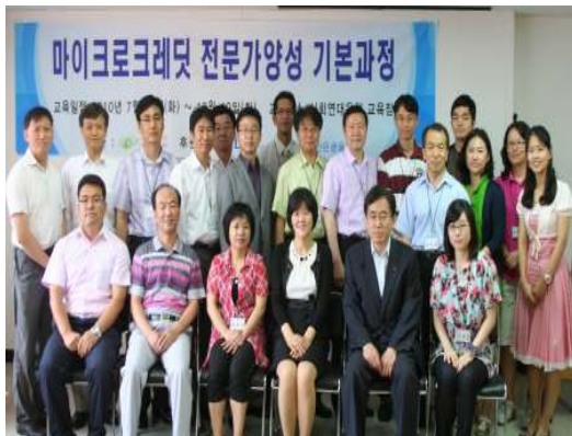
마이크로 크레딧 전문가 양성과정

2010년 KDB 산업은행은 서민 금융기관의 마이크로크레딧 사업을 지원하기 위하여 미소금융 중앙재단에 182억원을 기부하였습니다. 또한, '산은 사랑나눔재단' 에 25억원을 출연하였습니다. 이 재원을 바탕으로 '희망의 디딤돌-기능사 양성사업'과 '산은 창업지원기금' 등의 프로그램을 실시하여 저소득 금융소외계층의 자립을 돕기 위한 지원사업을 활발하게 실시하고 있습니다.