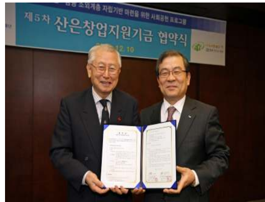
산은 창업지원기금 협약식