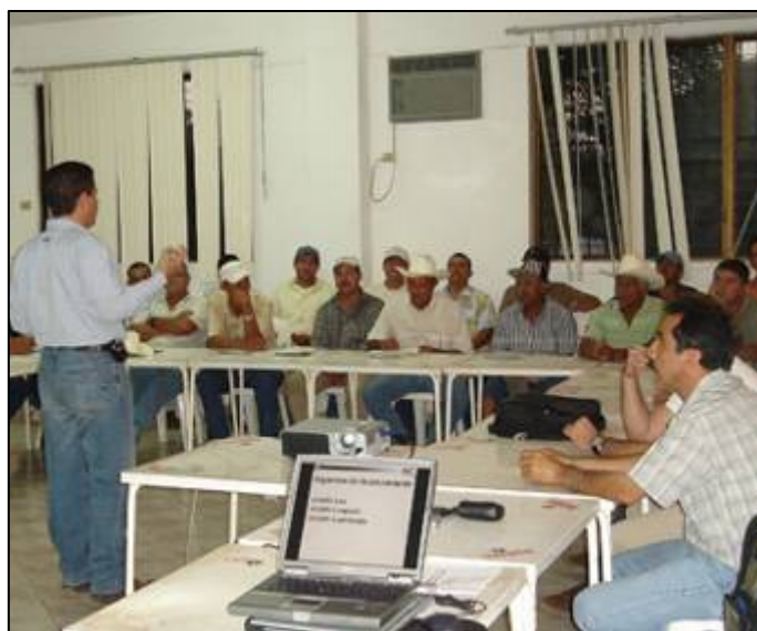
Seminario-El Rosario, Sin.

Darle valor a nuestra gente, para lograr desarrollar el negocio de cara al Cliente, ofreciendo productos y servicios de la mejor calidad.