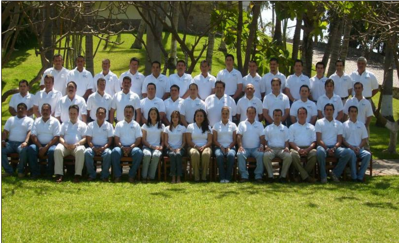
Reunión Comercial Mazatlán 2007