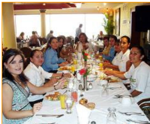
Desayuno en el DIA INTERNACIONAL DE LA MUJER