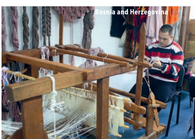
Bosnia and Herzegovina