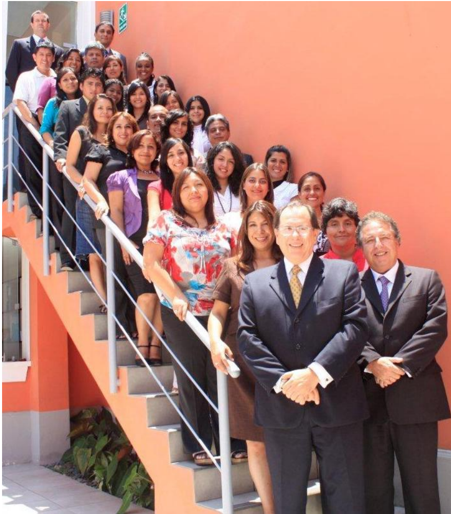
Colaboradores de Pacific Latam S.A.C.

"Pacific Latam S.A.C. es una empresa comprometida con los principios del Pacto Global, promueve y difunde los Derechos Humanos universalmente reconocidos, por tanto previene, evita, denuncia y rechaza cualquier tipo de atropello y abuso de los derechos fundamentales del ciudadano"