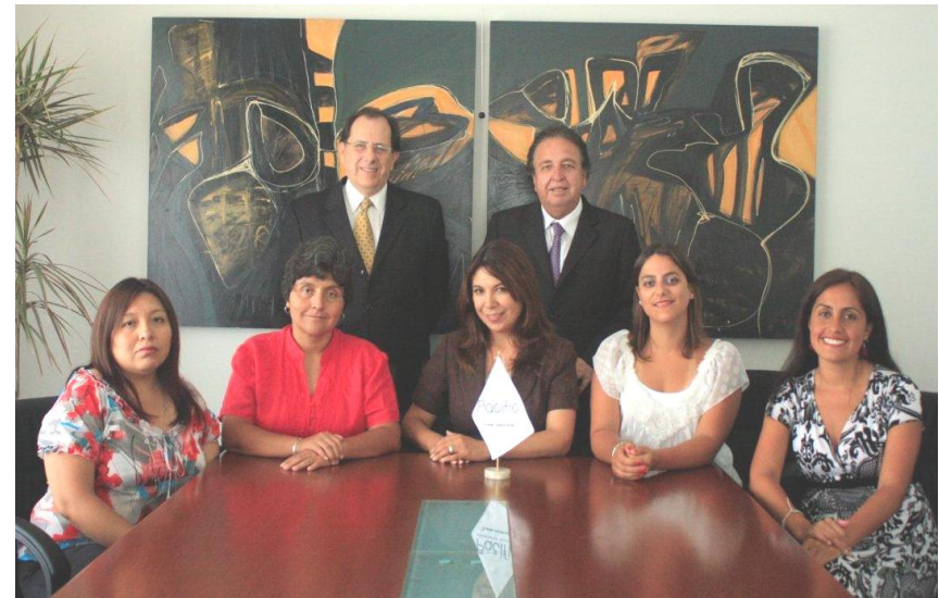
Ata Dirección Pacific Latam S.A.C.