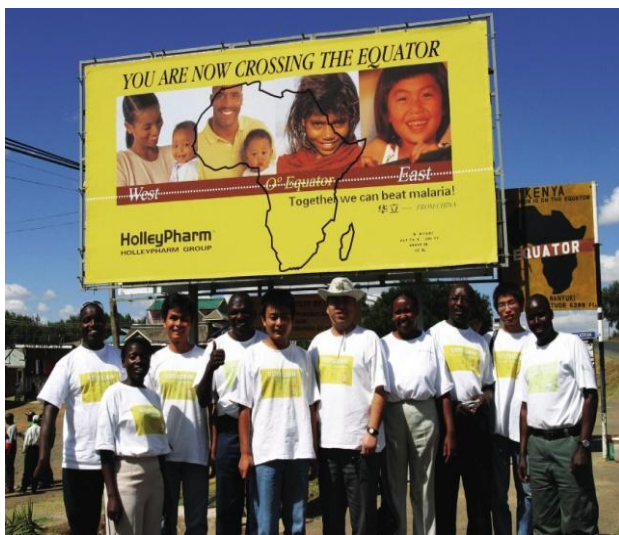
华立医药在赤道上的公益广告牌

华立集团以“创造社会福祉，实现人生价值”为理念，抱着对社会感恩的心，不断回报社会，认真履行社会责任，积极参与抢险救灾、扶贫济困、国际援助、人道主义等社会公益事业，以实际行动践行企业社会责任。