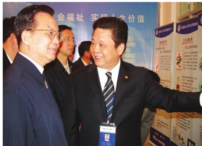
汪力成向国务院总理温家宝汇报华立特色植物资源药的发展情况