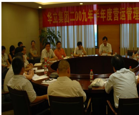
华立集团09年半年度会议

(3) 从预算体系和考核体系进一步强调现金流，以确保企业各项经营活动的顺利进行。通过这些措施，华立集团2009年的业绩实现了稳步的增长，体现了华立集团对投资者、对客户、对员工的经营业绩承诺。