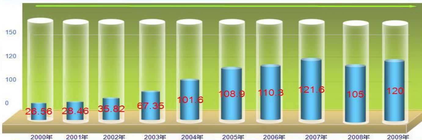
华立集团营业收入比较图

华立集团实现营业收入102亿元，实现归属于股东净利润1.24亿元，上缴国家及地方税金3.99亿元，向员工支付工资3.13亿元。