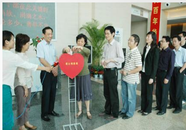
华立员工踊跃捐款