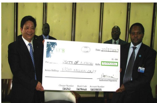
在肯尼亚内罗毕大学设立野生动物保护专业 奖学金

在非洲开展助学活动。在肯尼亚内罗毕大学设立“绿色共享·内罗毕大学奖学金”，用于奖励在环境和地理研究专业的优秀学生。在肯尼亚设立“绿色共享·华立医药奖学金”。该奖学金是中国国家主席胡锦涛2006年4月访问肯尼亚期间与肯政府签订《2006-2010年中肯教育交流协议》的内容之一。