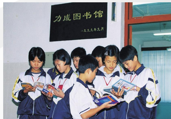
在百余所学校建立力成图书馆

浙江绿色共享基金会是华立集团董事局主席汪力成发起和捐赠的非公募基金会，于2007年5月成立，该基金主要开展贫困助学和野生动物保护工作。该基金会成立至今开展了大量的捐资助学行动，在中国浙江、重庆、内蒙古、湖北、云南、四川等省市自治区，多年来持续不断的资助贫困学子完成高等教育。其中2008年累计资助216名贫困学子、2009年资助147名贫困学子。