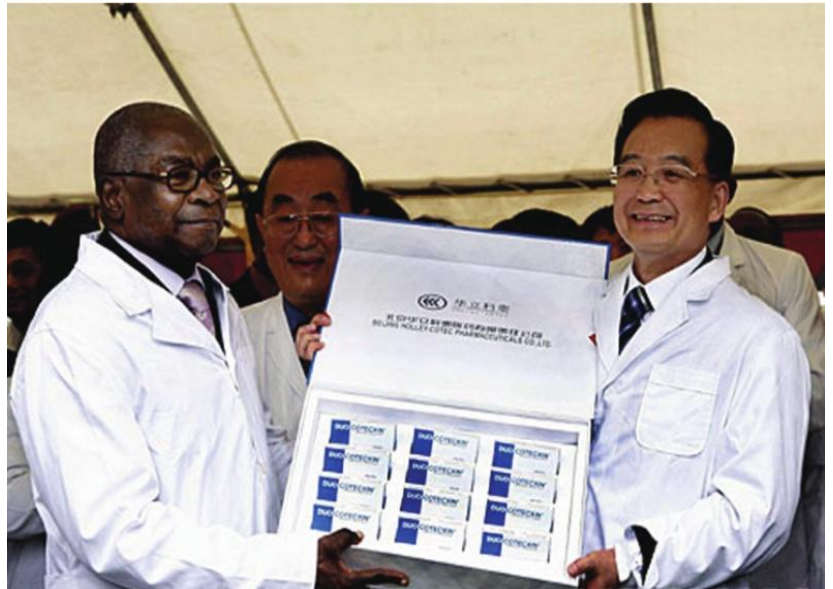
国务院总理温家宝访问非洲期间，向刚果赠送华立药业生产的抗疟产品“科泰复”

华立在追求增进社会福祉的理想中不断发展壮大，华立人在追求这一崇高理想及事业目标中不断实现人生价值。