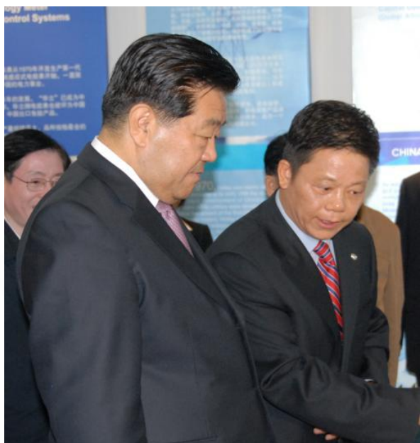
汪力成向全国政协主席贾庆林汇报华立发展情况

创造社会价值是企业不断发展的动力，也是企业回报社会的最根本方式。华立集团以“共和、共创、共和、共享”的核心价值观及“增进社会福祉，实现人生价值”的企业宗旨，把推动社会进步，创造社会价值，作为企业发展的终极使命。本着对股东负责，对客户负责、对员工负责、对社会负责的态度认真履行华立集团的企业社会责任。