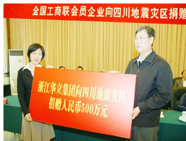
华立通过全国工商联捐款

期间，华立集团内有600名员工踊跃参与义务献血活动。此外，华立集团积极投身于灾后重建工作，确定什邡市禾丰虹桥小学作为华立的援建学校。在地震救援工作结束后，积极展开华立集团第三期捐助方案，发动员工助养地震孤儿。