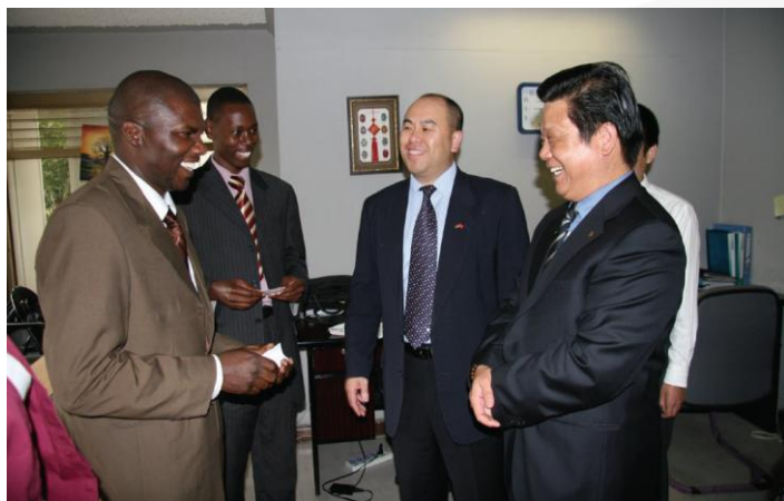
“科泰复”得到肯尼亚高度重视

华立的青蒿素类系列抗疟药品不仅挽救了数百万非洲人的生命，而且成为许多非洲国家高级官员之间相互赠送的高档礼品。另外，我国领导人或有关部门出访非洲时也经常选定“科泰新”为国家礼品或援助物资馈赠给非洲国家，为进一步加强中非政治友好关系和促进中非经贸互利合作做出了贡献。