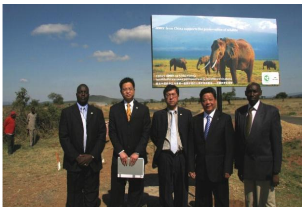
在非洲马赛马拉设立了“绿色共享赛马拉野生动物保护基金”

在动物保护方面，在非洲肯尼亚东南部马赛马拉国家野生动物保护区，设立“华立绿色共享马赛马拉野生动物保护基金”，每年向此基金捐款16万元，用于保护区的保护和研究工作。