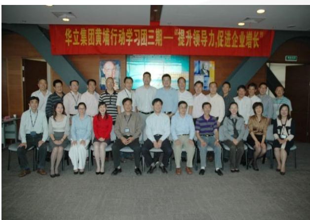
黄埔三期毕业留念

华立集团在人权工作及员工利益方面的工作得到的社会的认可。分别获得中国企业家联合会评选的《中国民营企业人力资源竞争力50强》、《浙江省政府评选的浙江省企业社会责任建设试点单位》、《浙江省最受尊敬企业》浙江省企业家联合会评选的《浙江省最佳雇主》等荣誉和称号。