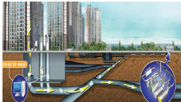
쓰레기 자동수거시스템(동별 설치)

위시티블루밍 아파트 내 쓰레기 집하시설은 입주인들이 배출하는 생활쓰레기를 진공관을 통해 단지 밖으로 보내어 환경오염을 예방하고, 단지내에 쓰레기차가 다니지 않도록하여 쾌적한 주거시설을 제공하기도 하며, 쓰레기 처리에 따른 에너지를 절감할 수 있도록 구축하였습니다.