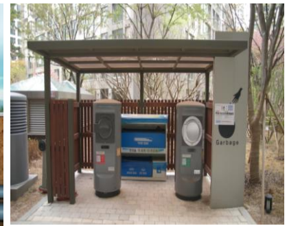
쓰레기 자동수거시스템 투입구