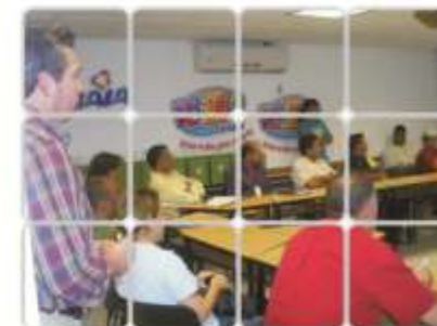
Presentación del programa de Responsabilidad Social a proveedores Lala Guadalajara