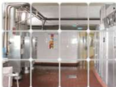
Aprovechamiento luz solar