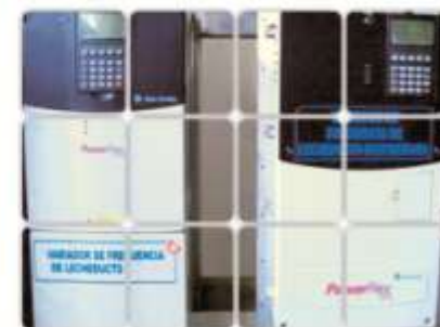
Variadores de frecuencia para evitar picos en consumo

Mediante sistema de administración de energía eléctrica, se programa arranque de equipos a diferente tiempo, lo que evita demanda excesiva de este recurso, disminuyendo picos de consumo.