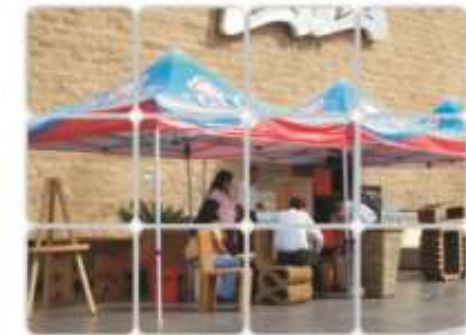
Alianza con Arte Kraft