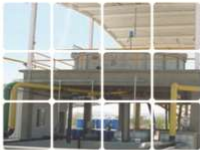
Planta Tratadora de Agua Residual Complejo Industrial Lala