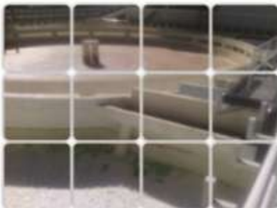
Planta Tratadora de Agua Residual Lala Aguascalientes

La visión de sustentabilidad en Lala se basa en el uso eficiente de los recursos hídricos, energéticos, materias primas, disminución de generación de residuos y el aumento de la tasa de reciclaje de los mismos. Con el objetivo de cuidar el medio ambiente, aprovechar los recursos disponibles y cumplir con el marco legal-ambiental.