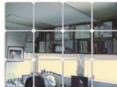
Aprovechamiento luz solar

En conjunto con lo anterior se realizan campañas para concienciar al personal, como apagar equipos y luces cuando éstas no sean utilizadas.