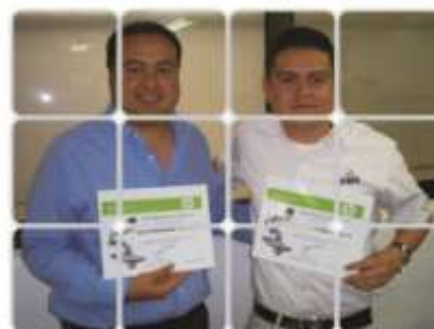
Alianza con Hewlett Packard México