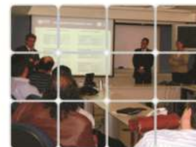
Programa “De Empresario a Empresario, juntos por la Competitividad”