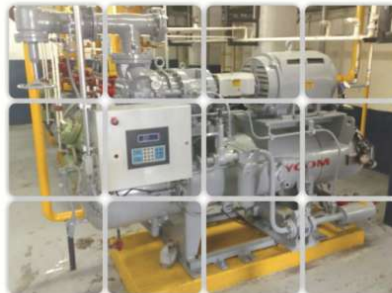
Sistema de enfriamiento que reduce uso de Amoniaco, Lala Torreón

En el 2009, se dejaron de emitir a la atmósfera 16,000 toneladas de CO 2 gracias a la disminución en el consumo de combustibles fósiles.