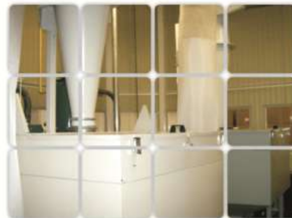
Mangas colectoras de polvos

Otras actividades incluyen capacitación en Fábrica para la separación de los residuos, recolección de pilas y donación de tambo a escuelas para la correcta segregación de residuos sólidos.