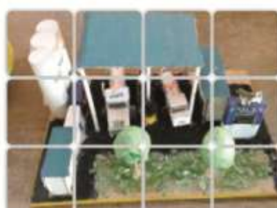
Concurso de arte con material reciclado

En 2009 sumaron 47 campañas, participaron más de 10,000 colaboradores involucrando a 6,700 familiares.