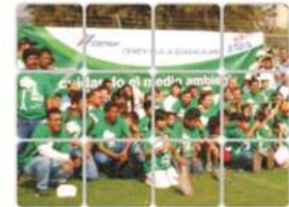
Alianza con CEMEX

Arte Kraft: Reciclaje de cartón para muebles de fibra ecológica.