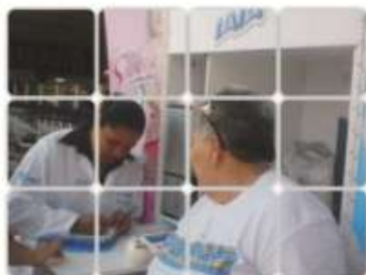
Programa de orientación alimentaria Instituto Lala

La empresa contribuye al desarrollo gerencial y de capacidades técnicas de sus productores, proveedores y clientes, para mantener relaciones comerciales duraderas.