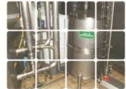
Retorno de Agua de Enfriamiento Programa Ahorro de Agua en Ultra Lala

Actualmente se reutilizan más de 140,000 m3 de agua en forma anual.