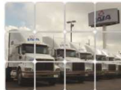
International 9200i equipadas con un motor electrónico Cummins ISX-450