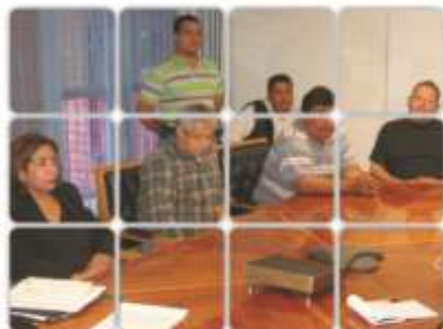
Entrega del Código de Ética a los proveedores de farmacias Nuplen Químicos