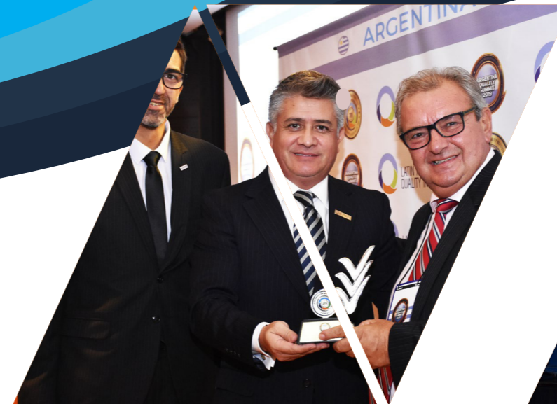
Argentina Quality Summit 2019

Con los temas de «Calidad Total» , La excelencia como pilar de valor para el futuro, acorde a los ODS: 1,4,5,8 Y 9 ; «Desarrollo Sostenible» , Agenda 2030 y el sector privado: como incluir los ODS en la estrategia del negocio, aplicando los ODS: 4,10 Y 12 «Compliance» Los retos del compliance y de la ética en las empresas, de acuerdo a los ODS: 4 Y 17 y el Módulo «Masterminds» de acuerdo a los ODS 1,4,5,8,10,16 Y 17 .