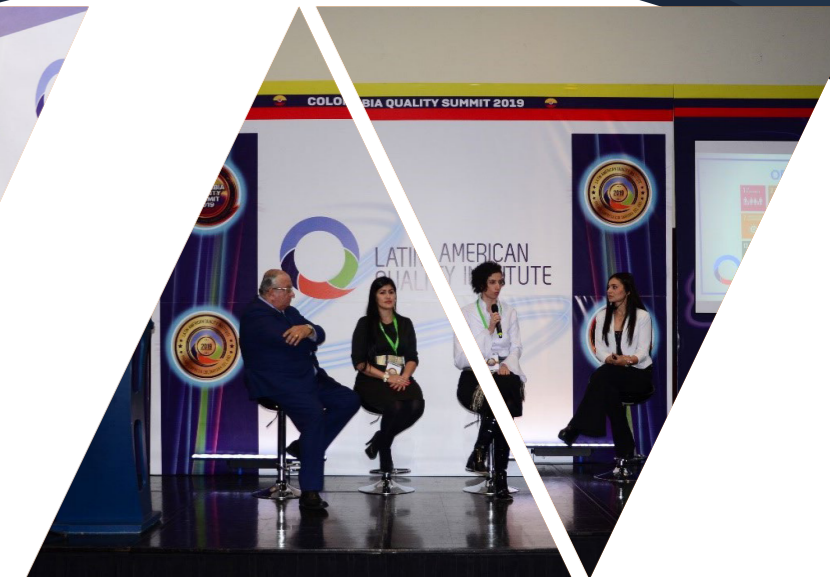
Colombia Quality Summit 2019