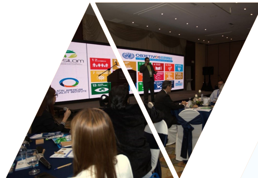
Ecuador Quality Summit 2019