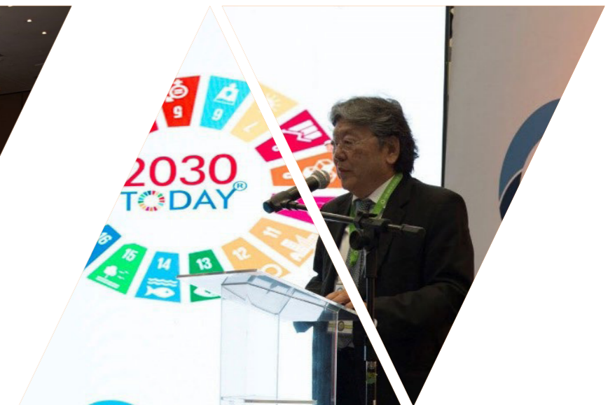
Brazil Quality Summit 2019