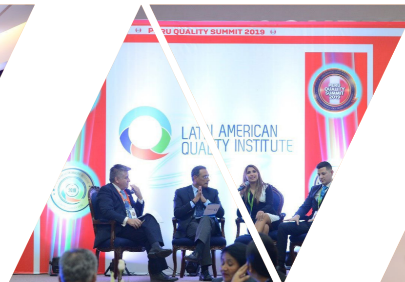
Peru Quality Summit 2019