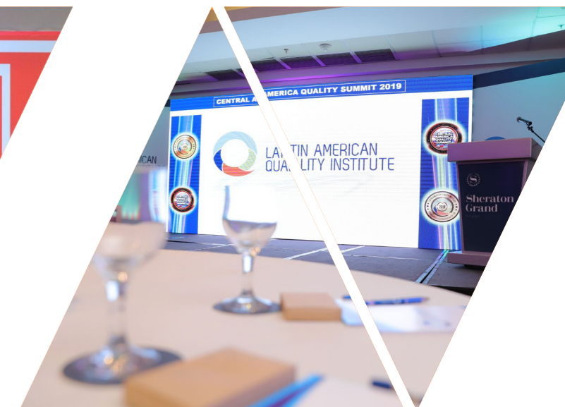
Central America Quality Summit 2019