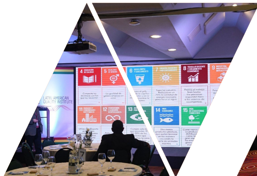
Bolivia Quality Summit 2019