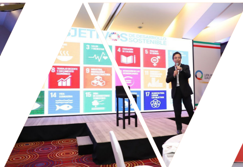
Mexico Quality Summit 2019